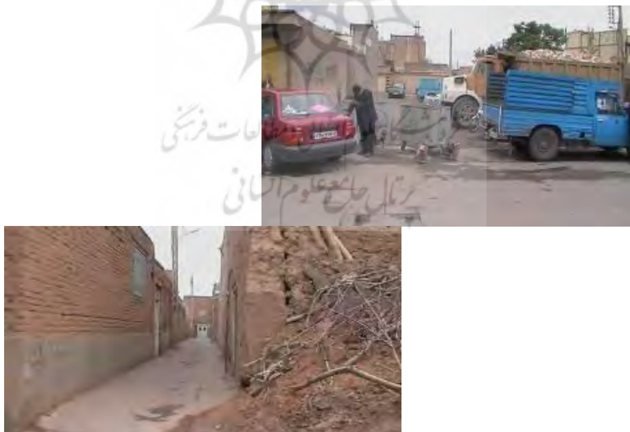
تصویر (۱): بافت کالبدی روستاهای ادغام شده