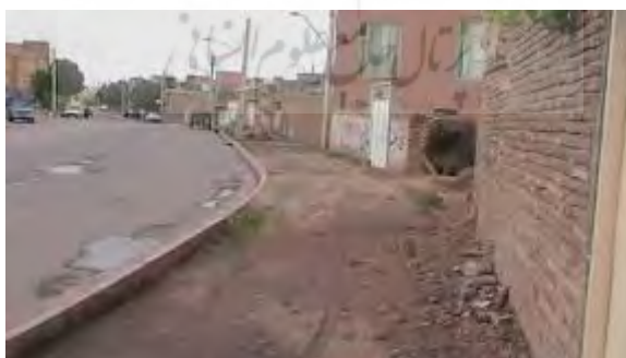
تصویر (۲): وضعیت پیاده‌رو در محله قراملک

در بین ۲۵ گویه پرسشنامه، بیشترین میزان نارضایتی بخصوص در بافت روستایی به وضعیت پیاده‌روها و نوع کفپوش و همچنین کم عرض بودن پیاده‌روها مربوط بوده است؛ به طوری که حتی در برخی از خیابان‌ها مسیر پیاده‌رو از سواره‌رو از هم مشخص نبود.