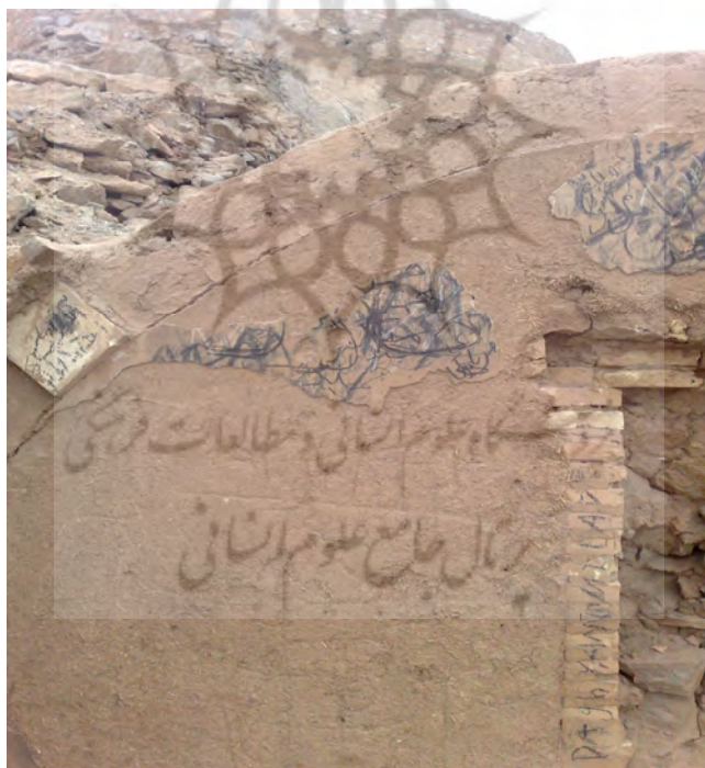
شکل ۱ اثر تاریخی: دخمه (گورهای زرتشتیان) شهرستان یزد

به منظور روشن شدن مقوله‌ی دیوارنویسی، تصویرهایی از دیوارنویسی بر مکان‌های تاریخی و باستانی شهرستان یزد آورده شده است: