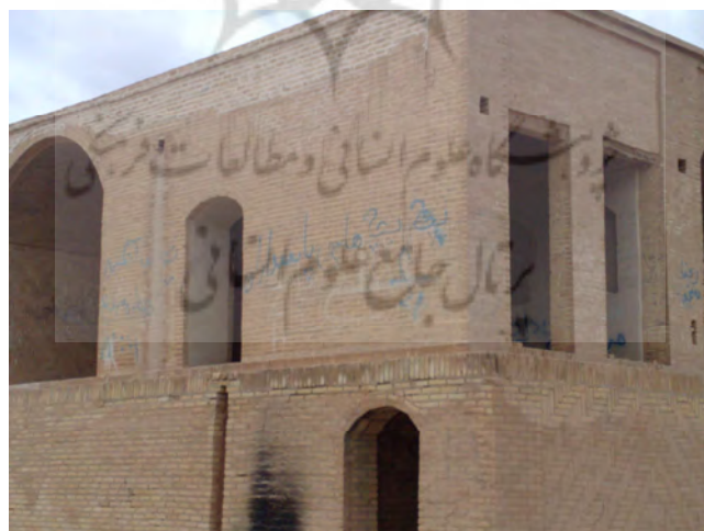
شکل ۳ ساختمان مجموعه گورهای زرتشتیان شهرستان یزد