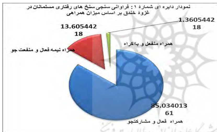
شکل شماره ۱: فراوانی سنجی سنخ‌های رفتاری مسلمانان در غزوه خندق بر اساس میزان همراهی