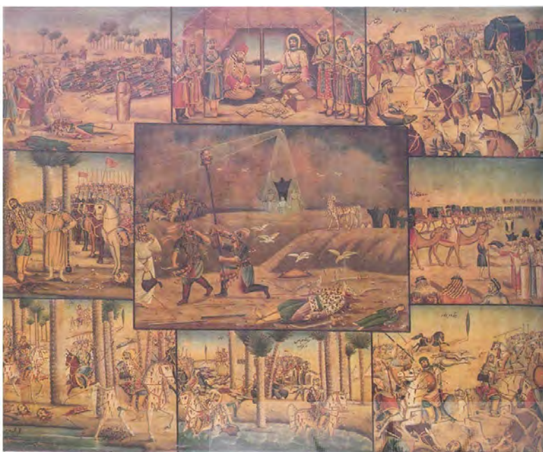
نقاشی قهوه‌خانه‌ای (مصیبت کربلا - گودال قتلگاه).