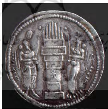
پشت سکه ننگاره آیزد مهر، آتشدان شلمه‌ور و شاهنشاه هرمزد