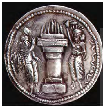
پشت سکه ننگاره آیزد مهر، آتشدان شلمه‌ور و شاهنشاه هرمزد.