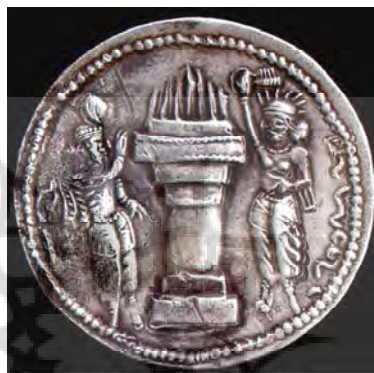
پشت سکه ننگاره آیزد مهر، آتشدان شلمه‌ور و شاهنشاه هرمزد.