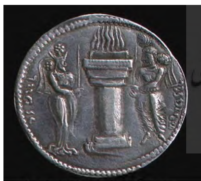
پشت سکه ننگاره شاهنشاه هرمزد، آتشدان شلمه‌ور و مهر هرمزدا