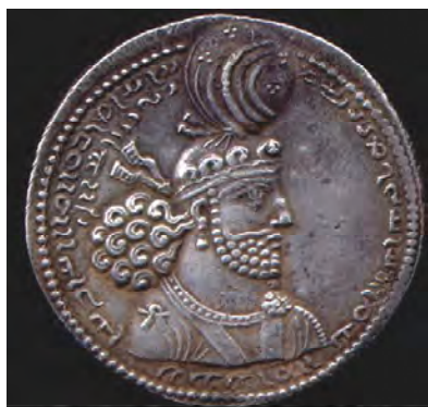
روی سکه ننگاره شاهنشاه هرمزد و نوشته بیخ در پارسیته، هرمزد شاهنشاه ایران و انیران که چهره از یزدان دارد.