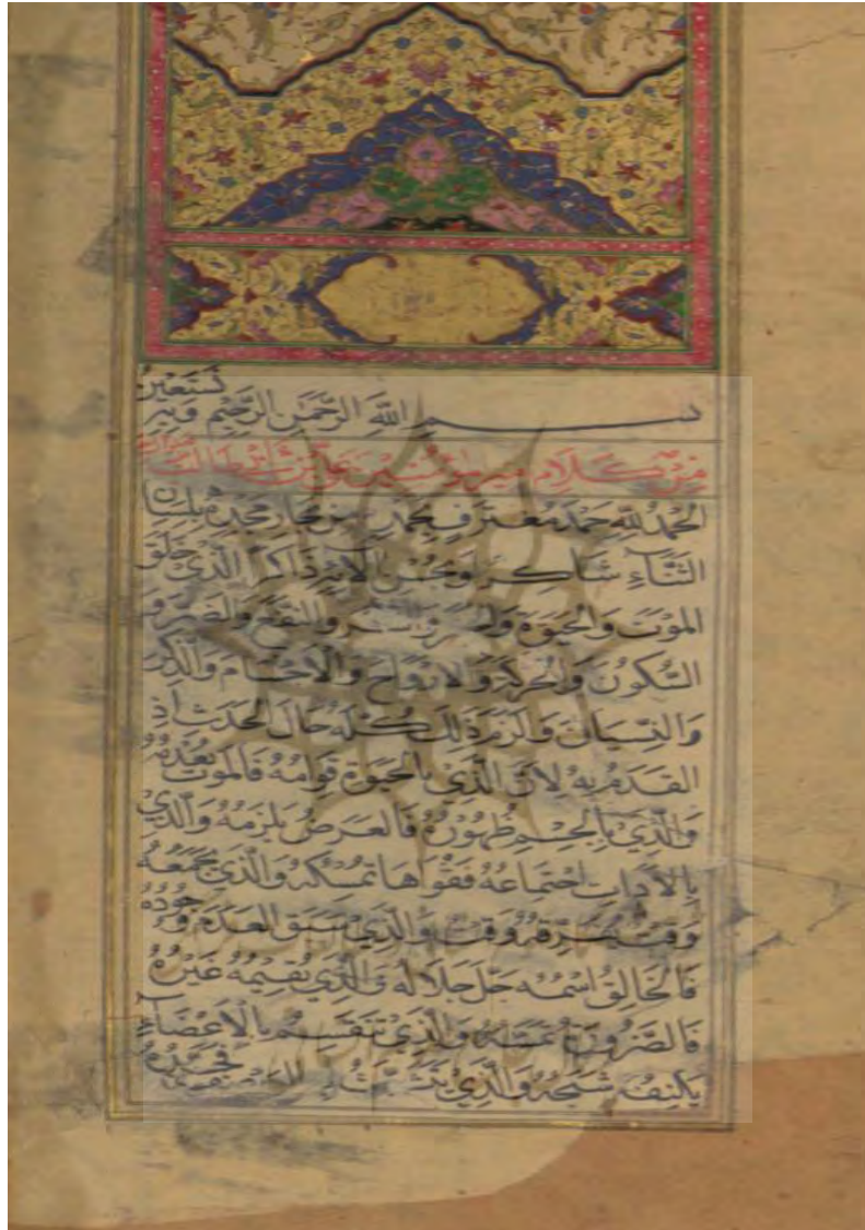
«صفحه اول از نسخه مذکور»