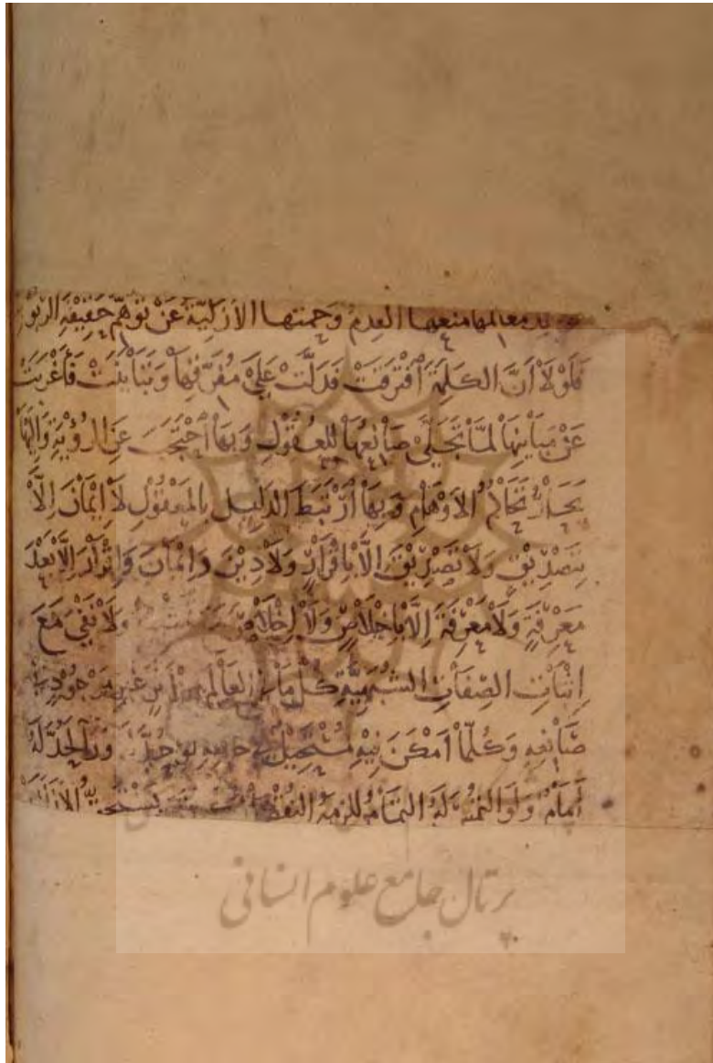
«صفحة پایانی از نسخه مذکور»