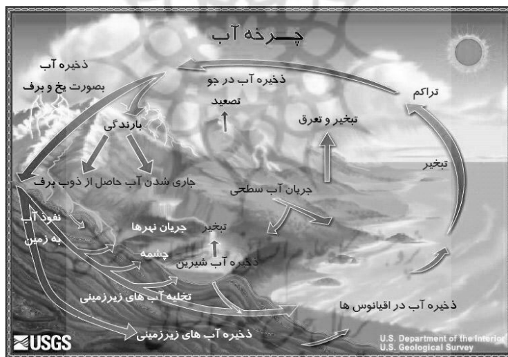
شکل شماره ۱

شکل شماره ۱ نمودار چرخه آب را نشان می‌دهد.