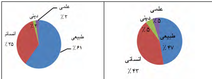
عناصر تصویر استعاری در شعر فارسی