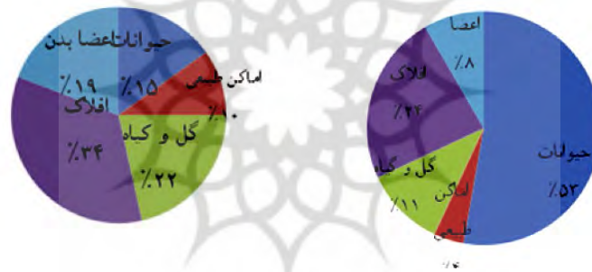
عناصر طبیعی و انسانی استعاره در عربی