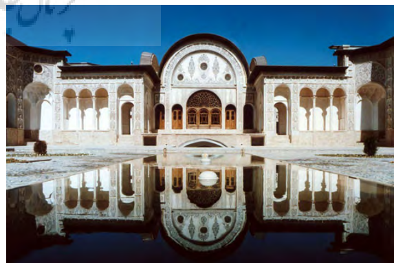
تصویر ۴: خاصیت آینگی یا تقارن‌محوری در آب و معماری. (خانه طباطبایی، کاشان). مرجع: www.archnet.org