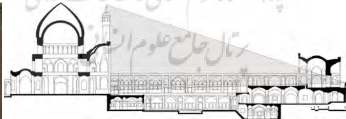
تصویر ۳: تناسبات و موقعیت گنبدخانه با حیاط و ورودی مسجد مدرسه آقابرگ کاشان. مأخذ نقشه: حاجی قاسمی، کامبیز. گنجنامه. انتشارات دانشگاه شهید بهشتی.