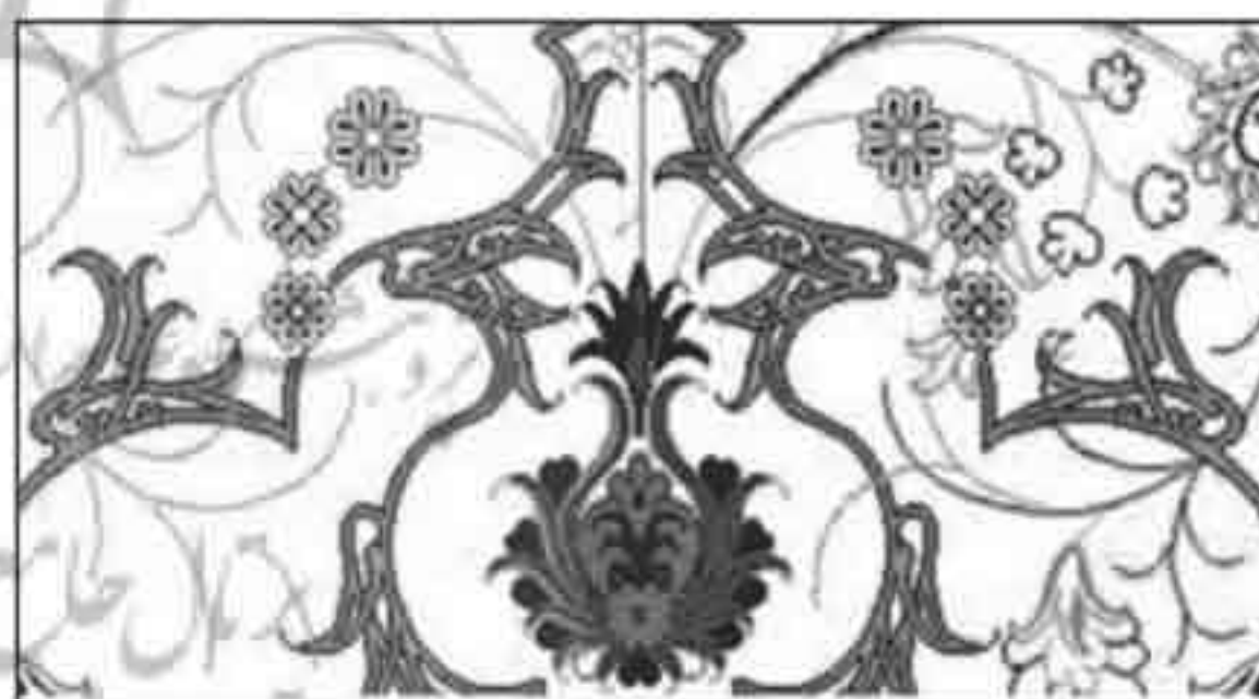
تصویر ۱۰: آماده‌سازی نقشه رایانه‌ای با رعایت اصول طراحی سنتی و دستی در تبریز

با توجه به اختصاص سهم قابل توجهی از تولیدات فرش تبریز به تابلوبافی از تصویرهای اشخاص، منظره‌ها و تابلوهای نقاشی، استفاده از رایانه و نرم‌افزارهای پشتیبان در تهیه نقشه‌ها جایگاه خاصی دارد با اینکه شیوه آماده‌سازی نقشه در محیط مجازی رایانه تقریباً از روش ثابتی پیروی می‌کند با این حال در نحوه ارائه نقشه‌های رایانه‌ای به بافندگان تفاوت‌های شاخصی وجود دارد که مطالعه جداگانه آن‌ها را ایجاب می‌کند.