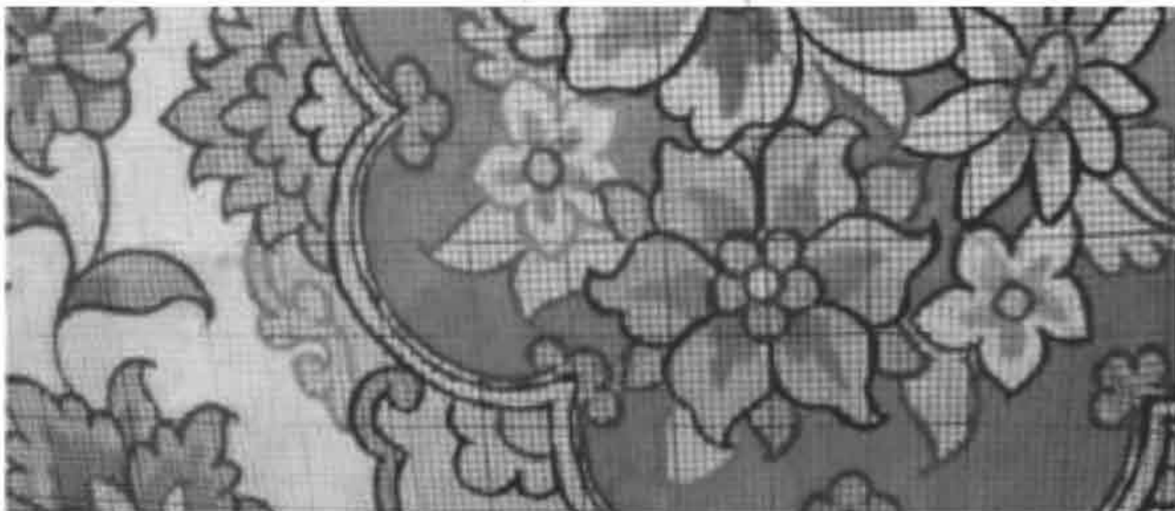
تصویر ۷: بخشی از یک نقشه رنگی دورگیری‌شده بدون نقطه‌گذاری خطوط جداکننده

«در بعضی مناطق ایران، بافندگان چنان ماهرند که می‌توانند از روی عکس یا یک طرح خام، اقدام به بافت قالی نمایند» (Eiland, 1998: 28). در این روش بافنده ماهر، عکس یا نقاشی را بر اساس اندازه و استاندارد مورد نظر برای بافت به وسیله یک شبکه مربع به نحوی که هر یکصد گره در یک مربع قرار گیرد (ده گره طولی و ده گره عرضی) تقسیم‌بندی می‌کند، سپس با چله‌کشی بر اساس خانه‌های به‌دست آمده اقدام به بافت آن می‌کند. در برخی مواقع نیز برای سهولت تشخیص مرزهای رنگی، اقدام به دورگیری اجزاء تصویر به وسیله مداد می‌کند. بافت این قبیل نقشه‌ها نیازمند دقت، مهارت و استعداد بالای هنری است. این سبک ارائه نقشه تا قبل از رواج نقشه‌های رایانه‌ای استفاده وسیعی در تابلوبافی تبریز داشت؛ ولی امروزه در بافت نقشه‌های هنری و بسیار ظریف استفاده می‌شود.