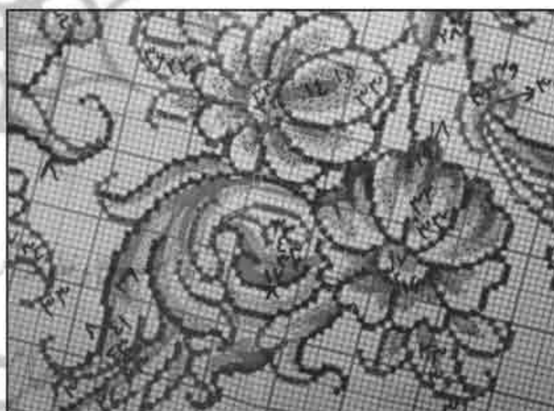
تصویر ۵: بخشی از نقشه نقطه‌شده بدون رنگ زمینه، رنگ سایه‌های ایجاد شده معمولاً در مرحله بافت با توجه به مستوره تغییر می‌کند.

رنگ و نقطه‌زدن است، توسط ماژیک و آبرنگ رنگ‌آمیزی و نقطه می‌شود. عمل نقطه‌کردن به بافنده در تشخیص محل دقیق گره‌ها و بافت سالم کمک می‌کند. از مزایای این روش می‌توان به مقایسه قسمت‌های بافته‌شده فرش با نقشه آن برای رفع عیب‌های احتمالی در هر مرحله از بافت اشاره کرد. این روش مطلوب بافندگان تازه‌کار نیز هست (تصویر ۳).