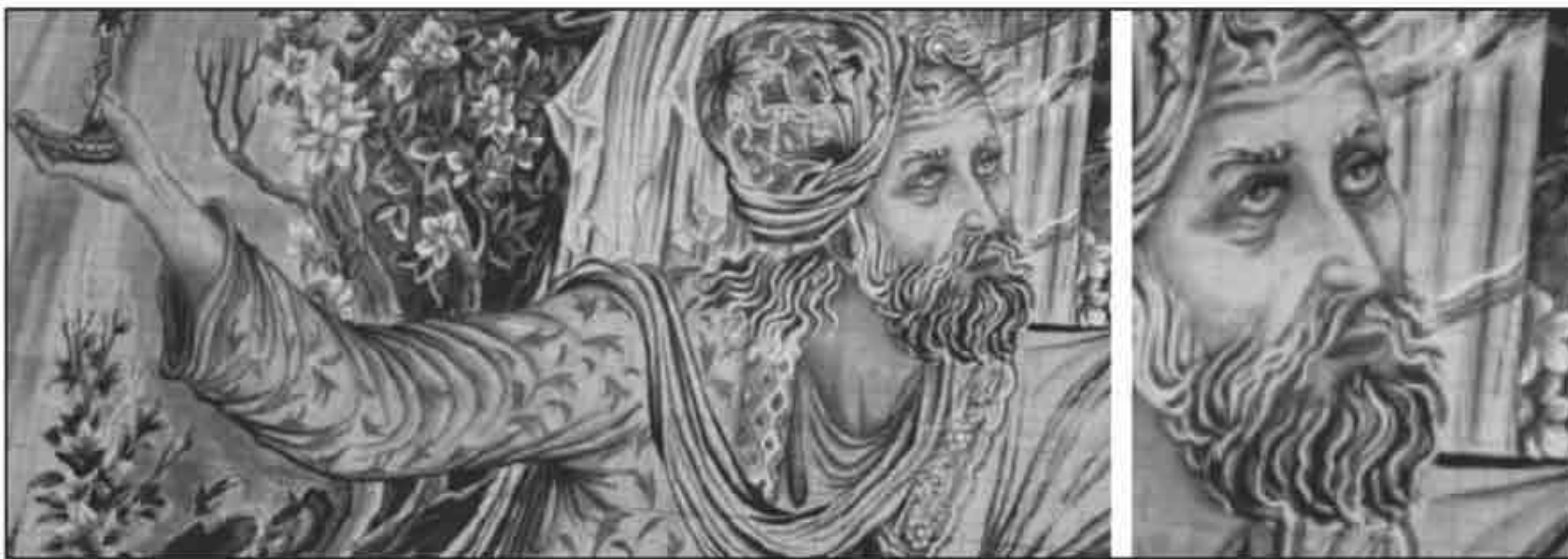
تصویر ۴: قسمتی از نقشه تصویری نقاشی شده بدون نقطه گذاری، اجرا شده روی کاغذ شطرنجی