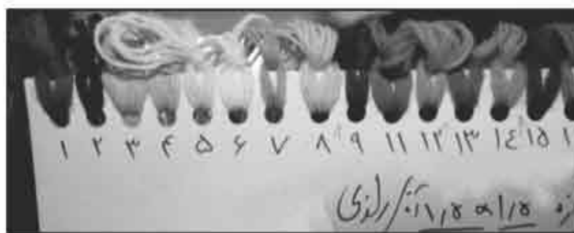
تصویر ۶: بخشی از یک مستوره رنگ، اندازه نقشه و شماره رنگ‌ها روی آن نوشته شده است.