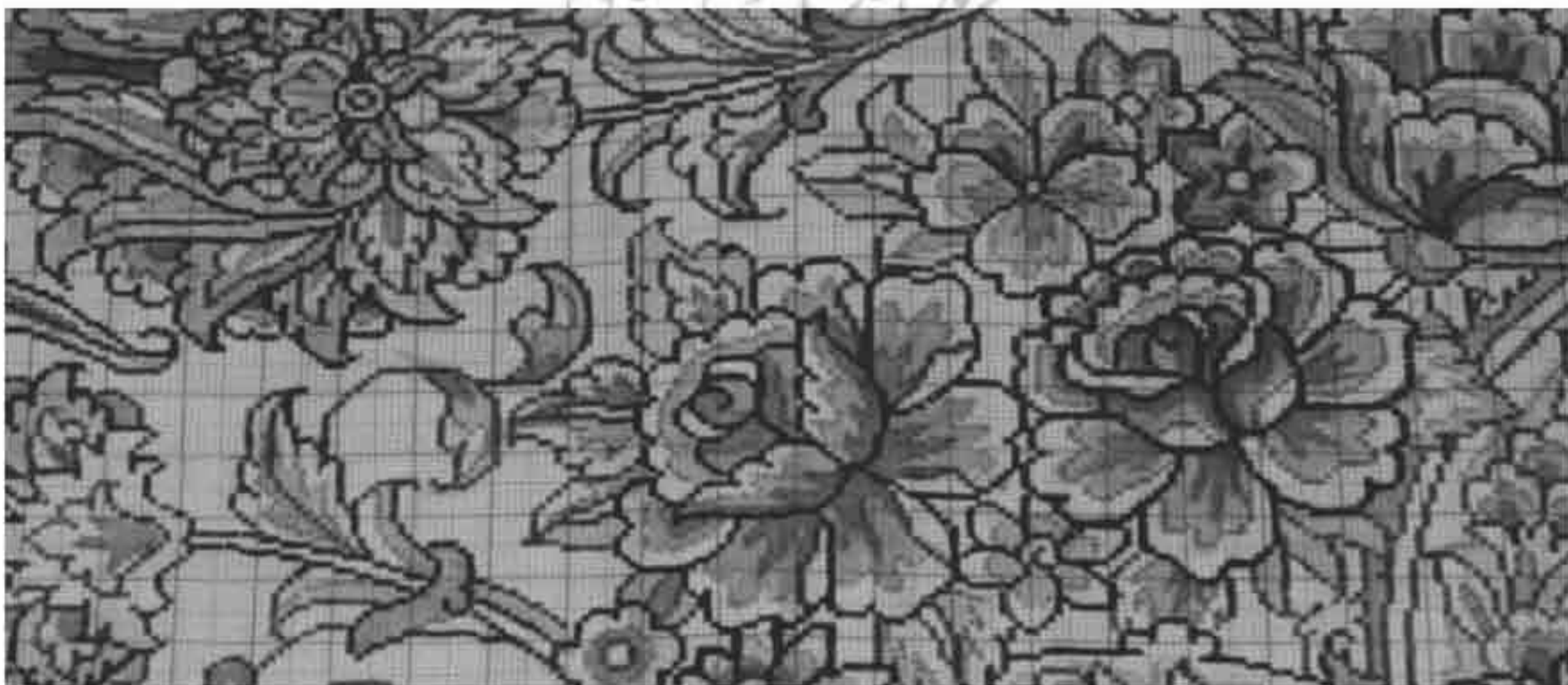
تصویر ۳: قسمتی از نقشه رنگ و نقطه‌شده به شیوه تبریز

قالی‌های تولیدی تبریز در تطبیق طرح و رنگ خود با سلیقه بازار شهره جامعه فرش‌اند. تبعیت از سلیقه بازار و تلاش برای برآورده کردن نیاز مشتری با تغییر مدام در طرح و رنگ قالی‌ها، سبب شده است تا سبک‌های طراحی فرش این شهر در نقطه مقابل طرح‌های سنتی منطقه‌هایی چون اصفهان قرار گیرند. تبریز به دلیل قرارگرفتن در مسیر تجاری ایران با دنیای غرب، بهره‌مندی از تجار موقع‌شناس و اقتباس از نقش‌مایه‌ها و ساختارهای طراحی سایر مناطق، پیش‌تاز تحولات جدیدی در عرصه طراحی و بافت قالی‌های ایران بوده است.