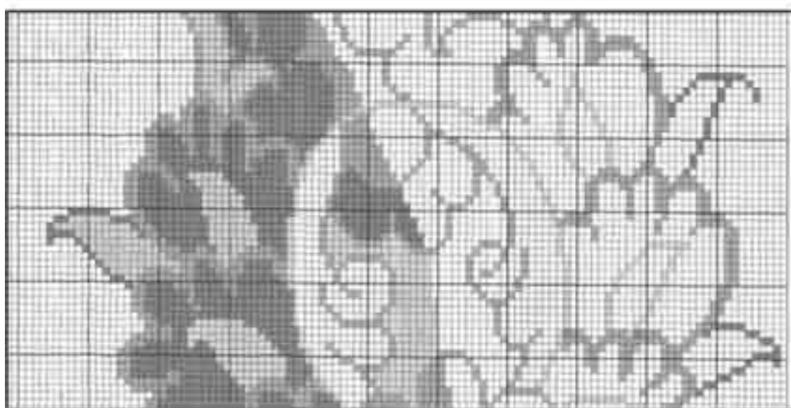
تصویر ۹: بخشی از یک طرح چابی شطرنجی شده توسط رایانه