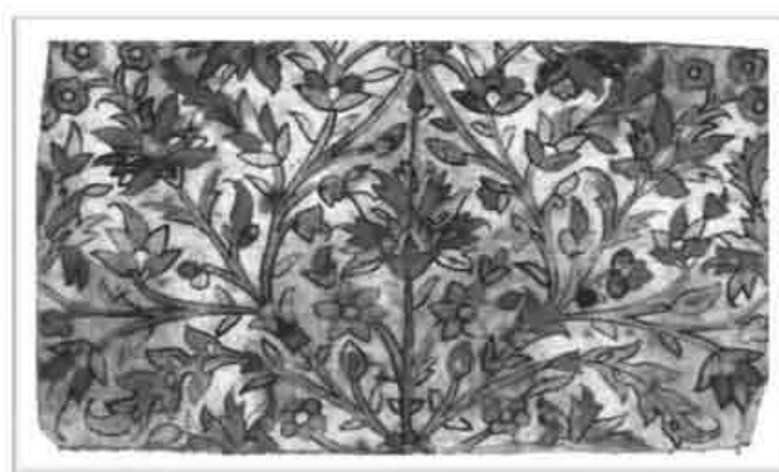
تصویر ۱: دستمال نقشه یا چسبی هریس، طرح واگیره‌ای (سر هم سوار) اجراشده روی پارچه کتان

آن، به‌ویژه در محیط کارگاه فرشبافی به نظر می‌رسد، پیاده‌کردن این طرح‌ها و نقوش آن روی پارچه‌های سفید و محکم (تصویر ۱) و یا بافت نمونه‌های کوچک با نقش‌مایه‌های اصلی فرش، موسوم به «اورنگ» یا «واگیره» (تصویر ۲) برای الگوسازی بافت فرش‌های بزرگ از راه حل‌های اولیه بوده است.