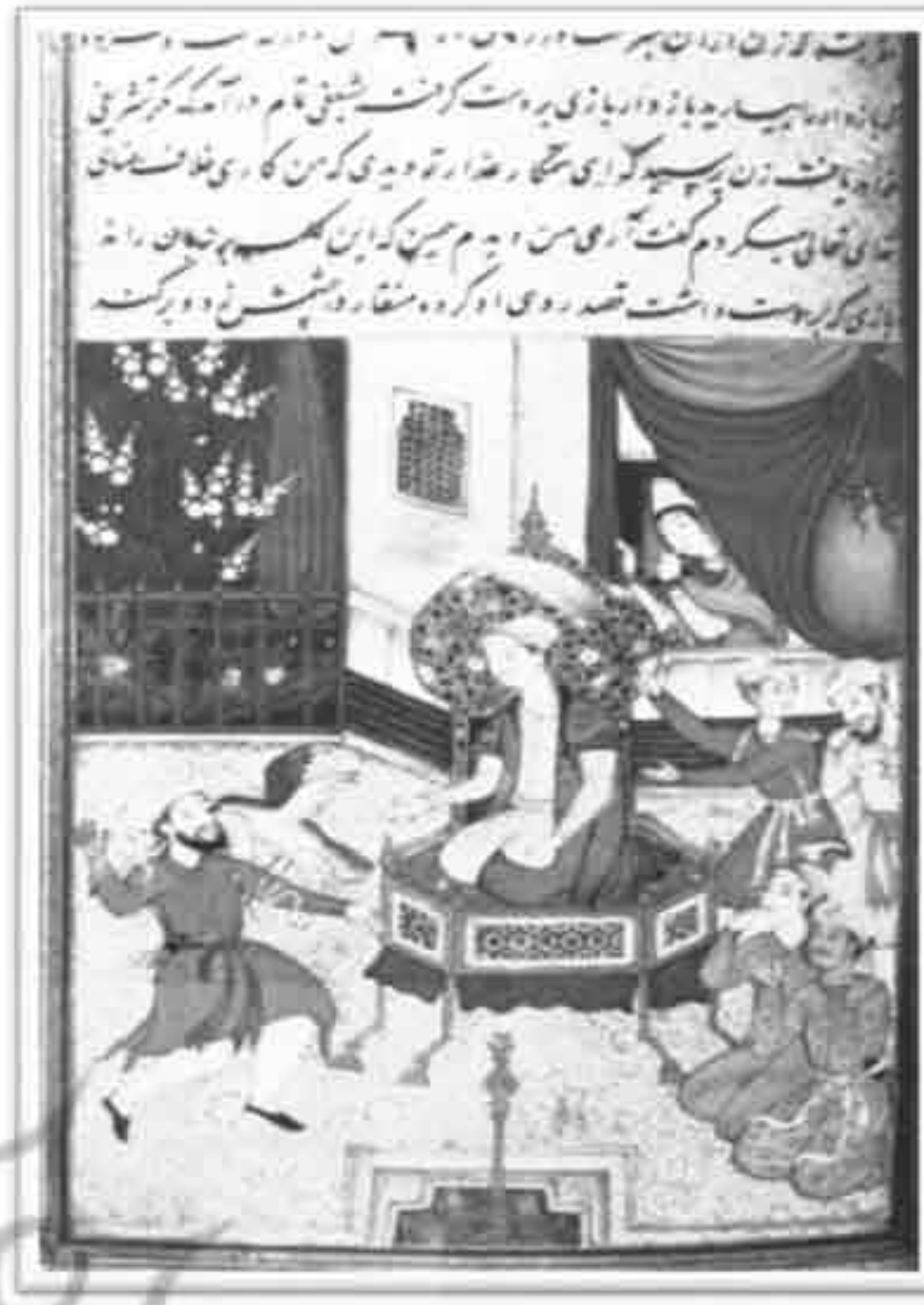
تصویر ۵: انوار سهیلی متعلق به دربار گورکانیان هند ۹۷۷ھ.ق / ۱۵۷۰م (Chandra, ۱۹۷۶)