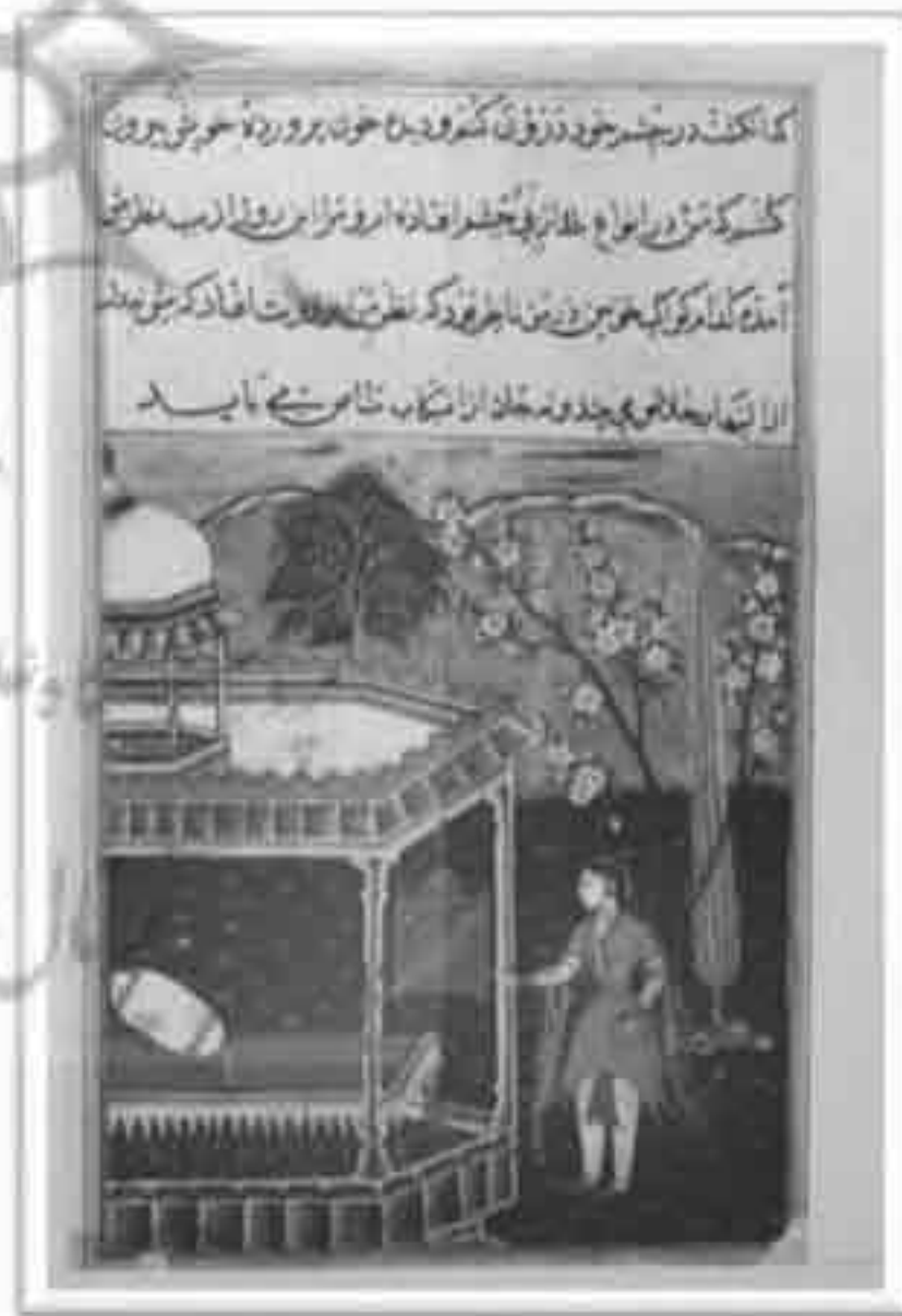
تصویر ۱۱: طوطی نامه موزه کلیولند، داستان شب هشتم (Ziyoudin Nakhshabi, 1978: 55)