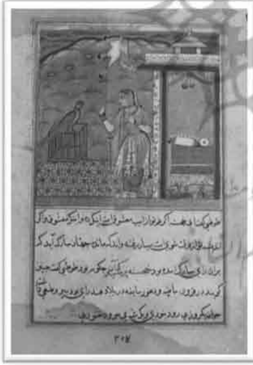
تصویر ۱۲: طوطی نامه موزه کلیولند، داستان شب چهل و چهارم (Ziyoudin Nakhshabi, 1978: 272)