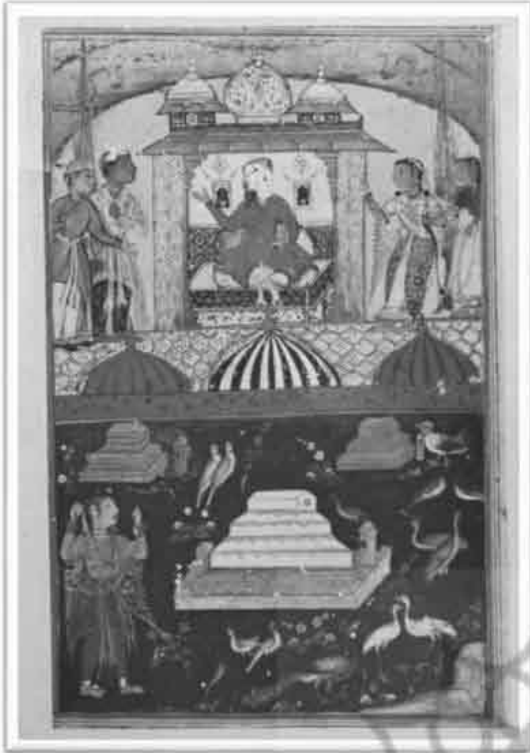
تصویر ۴: طوطی نامه موزة کلیولند، داستان شب اول (Ziyaudin Nakhshabi, 1978: 11)