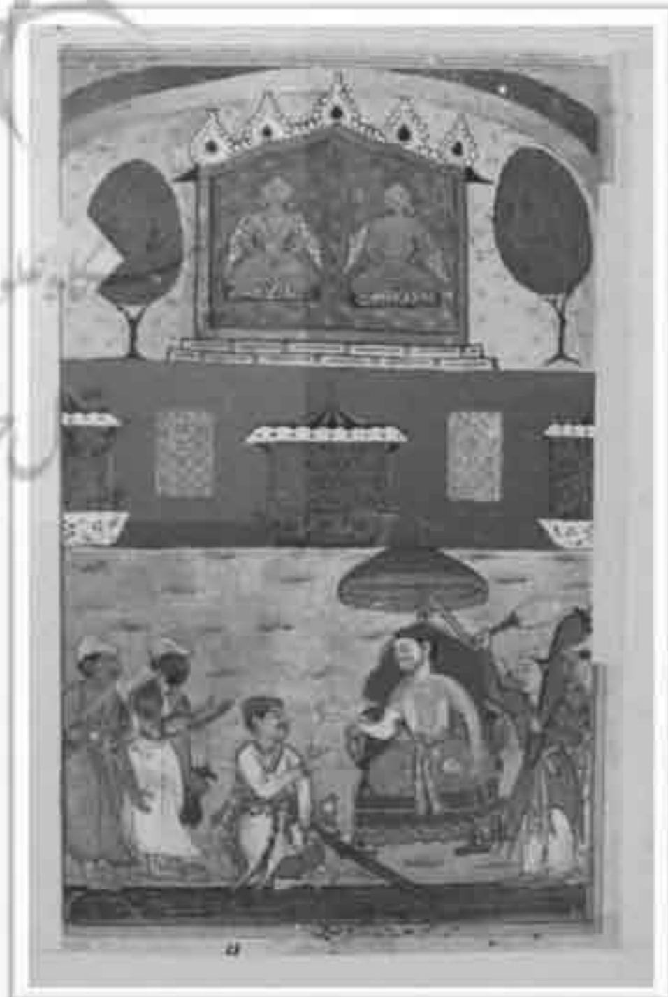
تصویر ۷: طوطی نامه موزة کلیولند، داستان شب سوم (Ziyaudin Nakhshabi, 1978: 24)