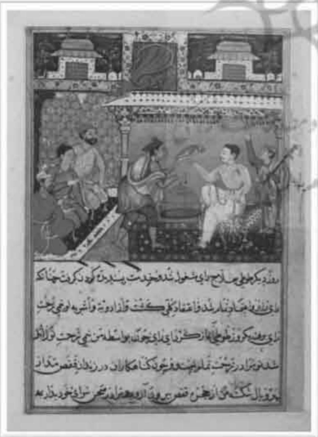
تصویر ۸: طوطی نامه موزة کلیولند، داستان شب پنجم (Ziyaudin Nakhshabi, 1978: 40)