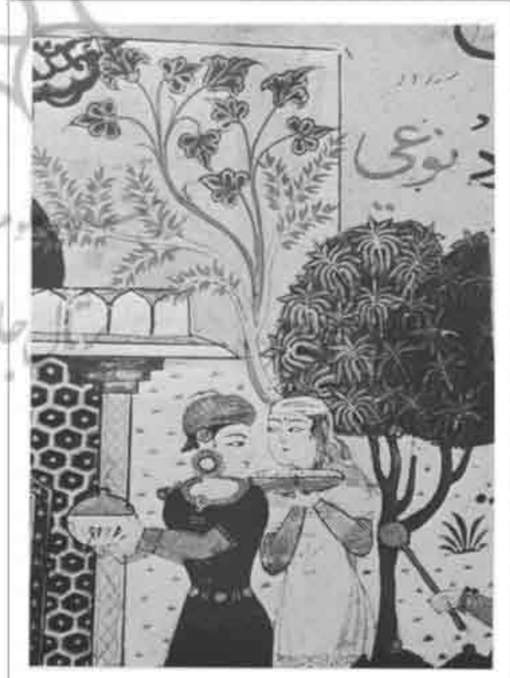
تصویر ۳: اثری متعلق به سبک هند و ایرانی، حدود قرن ۱۰/۱۶ ق. (Chandra, ۱۹۷۶)