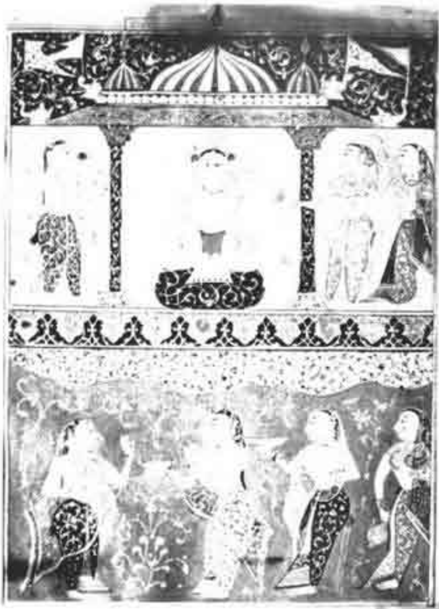
تصویر ۲: اثری متعلق به سبک کاندايانا، موزه شاهزاده ولز بمبئی، حدود قرن ۱۰/۱۶ ق. (Chandra, ۱۹۷۶)