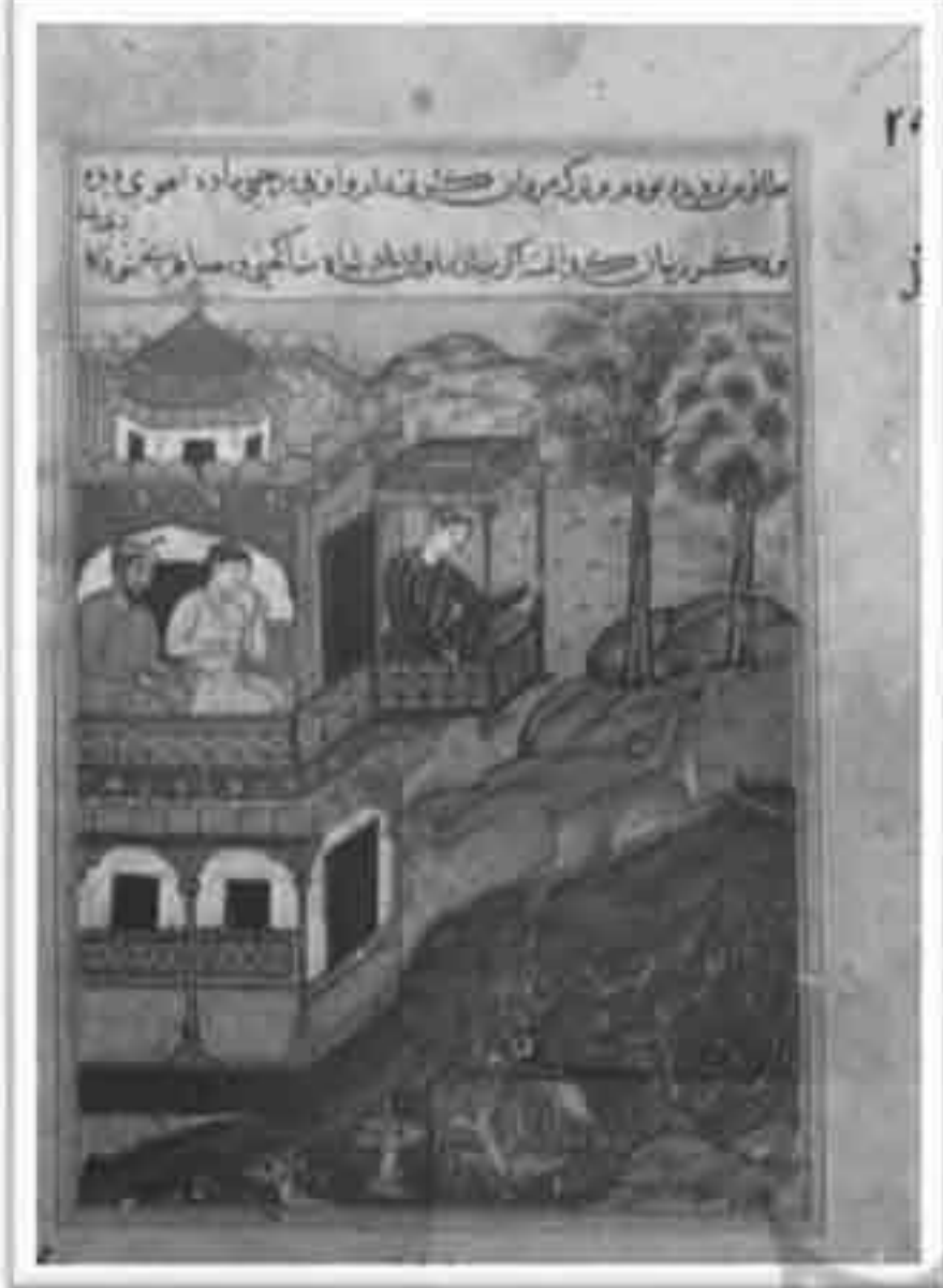
تصویر ۱۰: طوطی نامه موزه کلیولند، داستان شب سی و نهم (Ziyoudin Nakhshabi, 1978: 245)