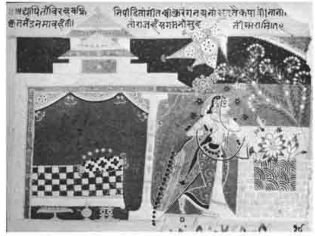
تصویر ۱: اثری متعلق به سبک کارانیکا، دهلی، حدود قرن ۱۰/۱۶ ق. (Chandra, ۱۹۷۶)