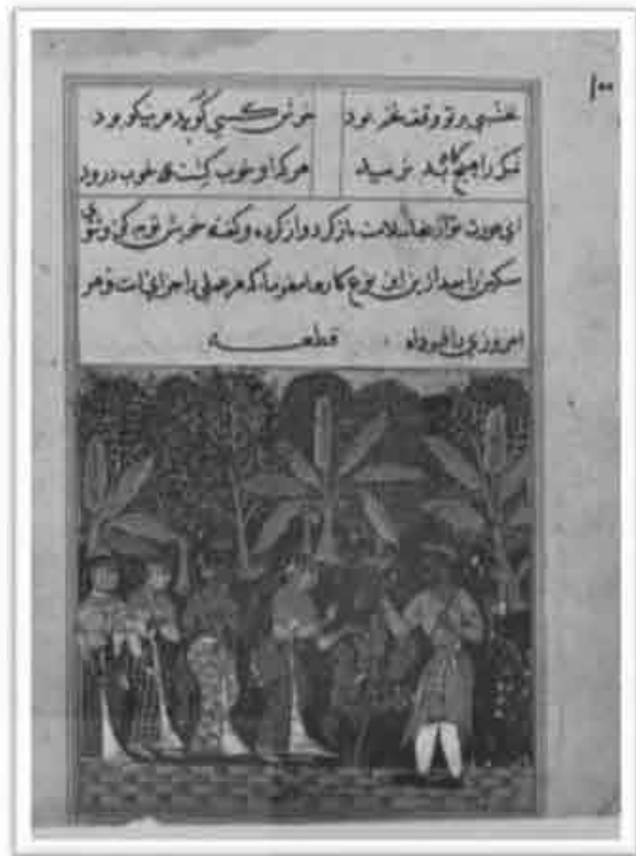
تصویر ۹: طوطی نامه موزه کلیولند، داستان شب دوازدهم (Ziyoudin Nakhshabi, 1978: 94)