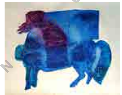
تصویر شماره ۳: بدون عنوان