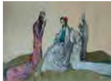
تصویر شماره ۴: بدون عنوان