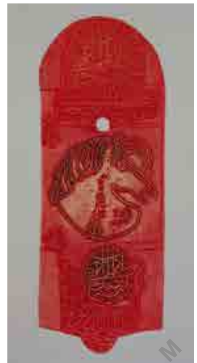
تصویر شماره ۲: بدون عنوان