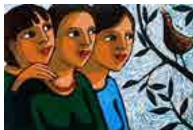
تصویر شماره ۵: مادر و دخترها با پرنده، لیتوکات