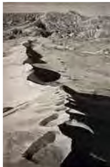
تصویر شماره ۲: سرگردان بیابان؛ اندازه اثر: ۱۹×۲۸ اینچ