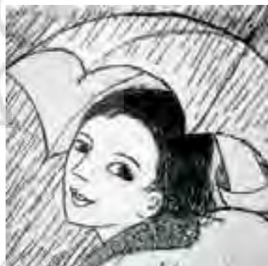
تصویر شماره ۳: باران، چاپ اچینگ