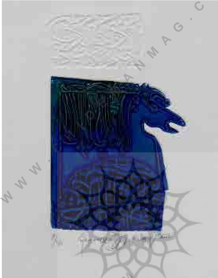
تصویر شماره ۵: بدون عنوان

گرافیسیت، متولد سال ۱۹۴۰ در شهر ترابزون [۲] ترکیه است.