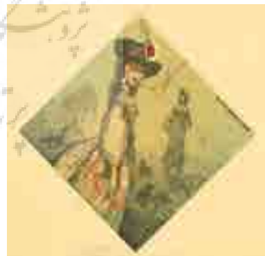
تصویر شماره ۳: Barend&Manto