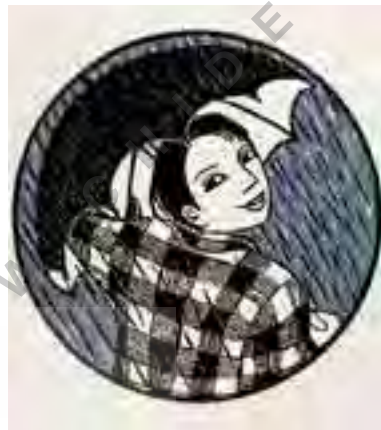
تصویر شماره ۲: روز بارانی، حکاکی روی چوب