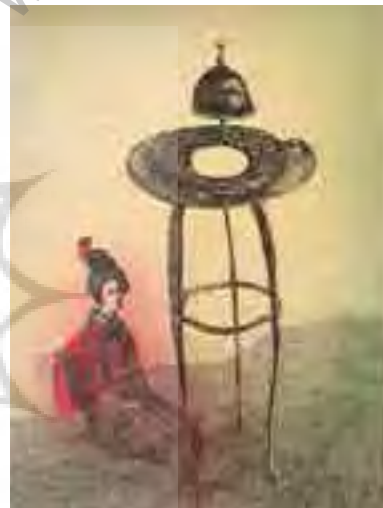
تصویر شماره ۲: Belby