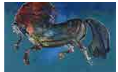
تصویر شماره ۴: بدون عنوان