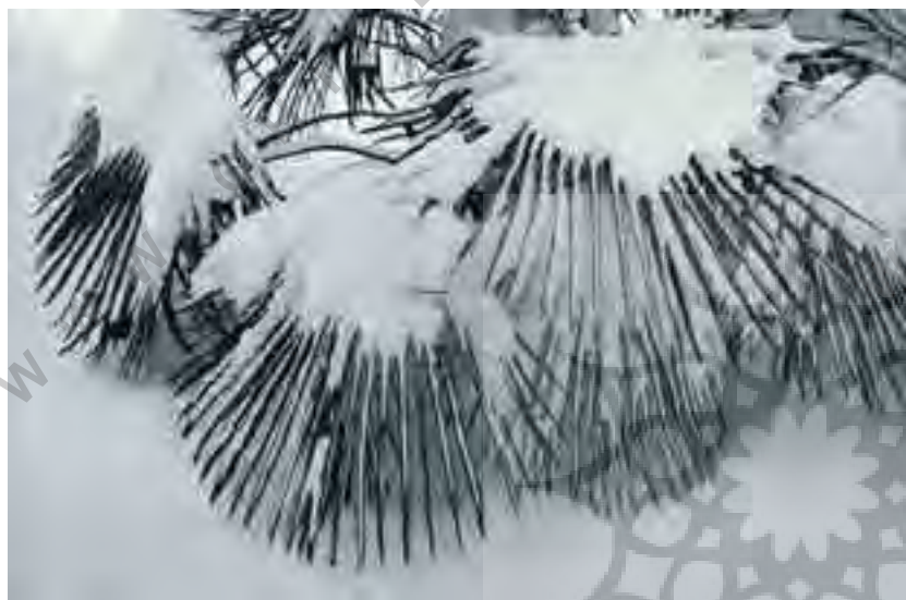
تصویر شماره ۷: نام اثر: درخت برفی؛ اندازه اثر: ۱۰/۲ × ۶ اینچ.