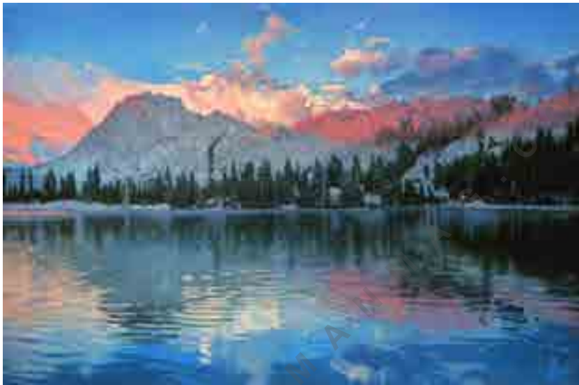
تصویر شماره ۶: نور کوهستان؛ اندازه اثر: ۱۲۱/۲ × ۱۸۳/۴ اینچ.