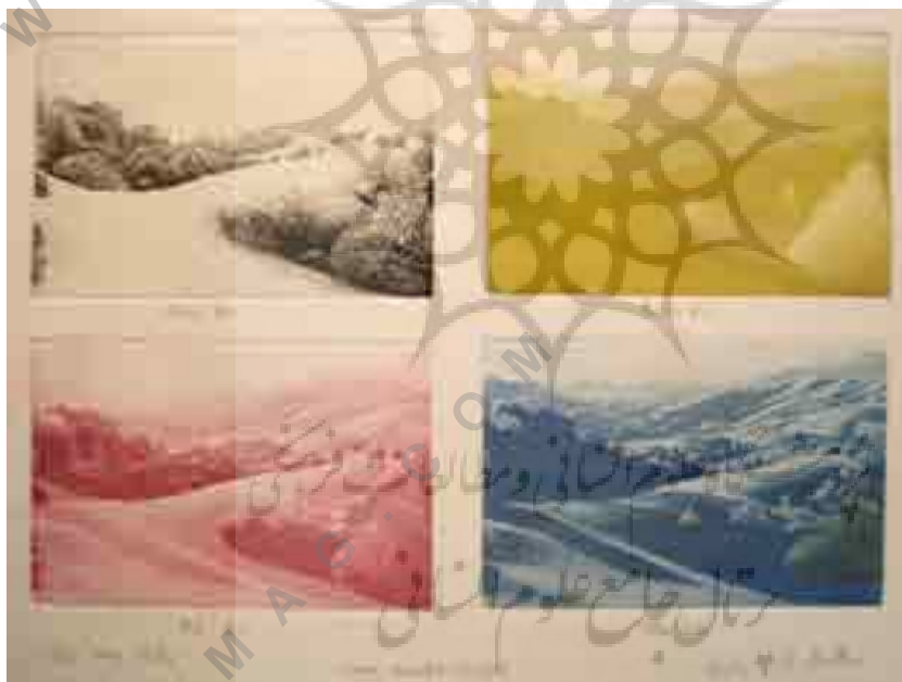
تصویر شماره ۵: تجزیه رنگی اثر «تپه‌های سن جین».

استفن مک میلان متولد ۲۱ دسامبر ۱۹۴۹ در برکلی کالیفرنیا، در خانه‌ای که دارای یک منظر وسیع از خلیج سان‌فرانسیسکو بود متولد شد. علاقه او به چشم‌انداز و منظره به‌عنوان منبع الهام در آثارش از همان دوران کودکی و با تأثیرات محل‌زیگیاش شکل گرفت. آثار مک میلان در سال ۱۹۶۹ برای نخستین بار در گالری هنری سانتا کروز به نمایش درآمد. از سال ۱۹۷۵ او با الهام از تصاویر طبیعت، در اجرای آثار خود بر روی تکنیک آکواتینت متمرکز شد. سفر در دل طبیعت و عکاسی از مناظر طبیعی مقدمه این آثار بود. از سال ۱۹۷۵ تا ۱۹۷۹ فعالیت هنری خود را با کار در آتلیه هنری گرافیک در سان‌فرانسیسکو دنبال می‌کرد. و در بین سال‌های ۱۹۷۹ تا ۱۹۹۲ در مؤسسه هنری کالاکا [۲] به‌عنوان مدرس هنری، فعالیت نمود. مک میلان در حال حاضر در بلینگهام زندگی می‌کند و به خلق آثار خود مشغول است.