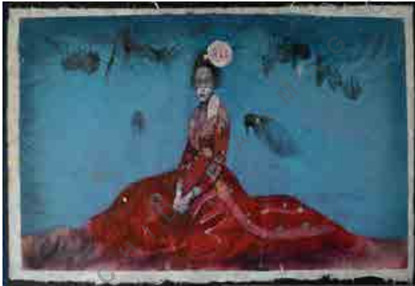
تصویر شماره ۵: Adanie