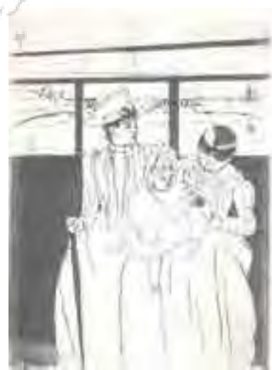
تصویر شماره ۱۳: مرحله چهارم.