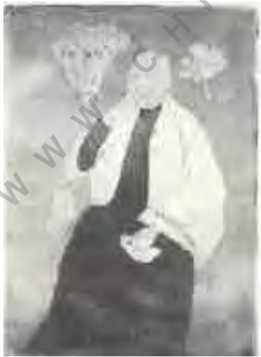
تصویر شماره ۵: مرحله سوم.