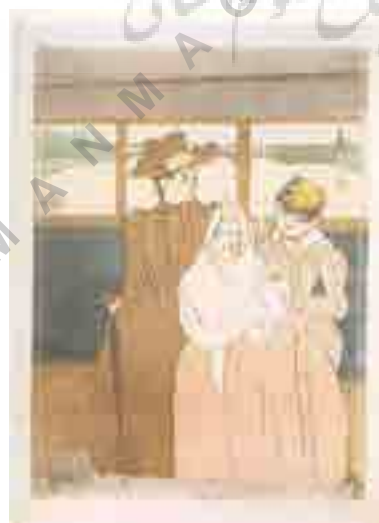
تصویر شماره ۱۵: مرحله هفتم.