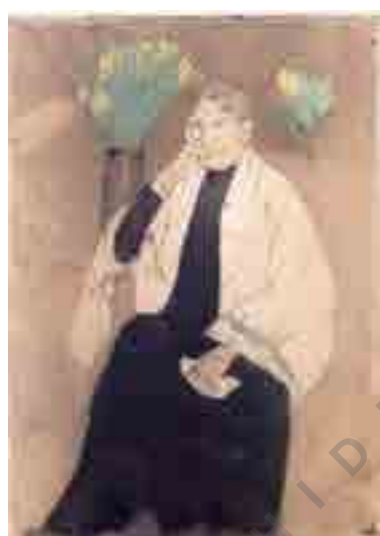
تصویر شماره ۶: مرحله چهارم.