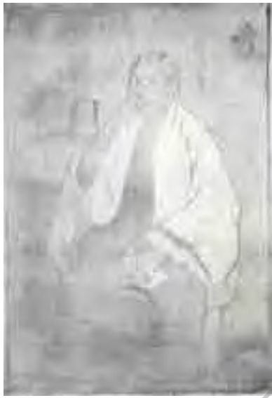
تصویر شماره ۴: مرحله دوم.