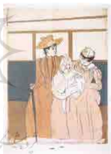
تصویر شماره ۱۲: مرحله سوم.