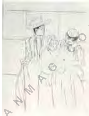
تصویر شماره ۱۰: مرحله اول.