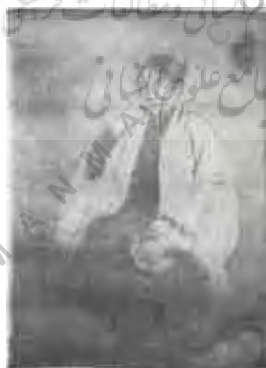
تصویر شماره ۳: مرحله اول.