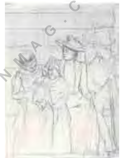
تصویر شماره ۷: هاری کاسات: