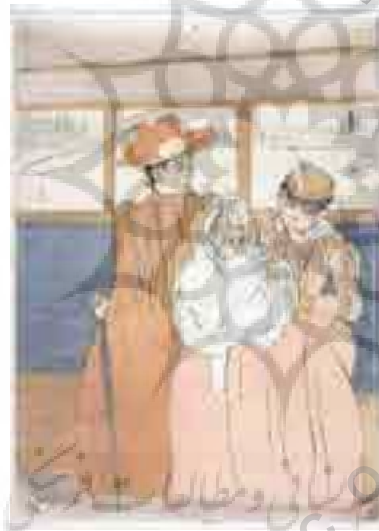
تصویر شماره ۱۴: مرحله ششم.

با تحقیق و بررسی آثار ماری کاسات، مشخص شد که وی اولین بانویی بود که روش‌های نوینی را در کالکوفرافی رنگی ابداع نمود. بررسی صوری و تکنیکی آثار وی، نتایج زیر را شامل شد.