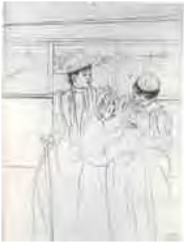
تصویر شماره ۱۱: مرحله دوم.