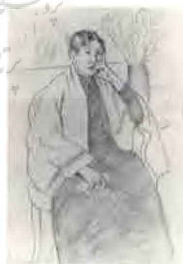
تصویر شماره ۲: ماری کاسات؛