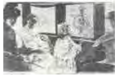
تصویر شماره ۹: (A Corner of the omnibus) Coin d'Omni bus ماری کاسات، ۱۸۸۷ میلادی.

دارد که به نظر می‌رسد برای انتقال انجام شده است.