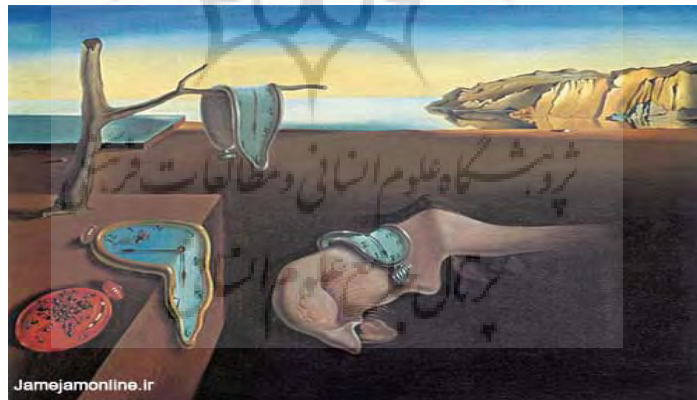
شکل ۱ «تداوم خاطره» (۱۹۳۱)، اثر سالوادور دالی، رنگ روغن، ۳۳ × ۲۴ سانتی‌متر

از آنجا که در زبان فقط برای مفاهیم قابل درک نشانه وجود دارد، برای بیان مفاهیمی که هنوز آن‌ها را درک نکرده‌ایم (مانند جاودانگی) نیز ناگزیریم نشانه‌های موجود زبانی را به کار ببریم. به این معنا که در نام‌گذاری این اثر که بر بی‌زمانی دلالت دارد، شاید منظور هنرمند از به‌کارگیری واژه تداوم (باوجود وابستگی‌اش به عنصر زمان)، گذر از مرز زمان و بی‌زمانی بوده است و چنان تداومی آن‌قدر ادامه می‌یابد تا به قلمروی بی‌زمانی و ابدیت راه یابد. در این صورت، نشانه‌های تصویری و کلامی در این اثر همسو هستند و بر مفهوم «جاودانگی» دلالت دارند. «خاطره» زمان کمی را به زمان کیفی تبدیل می‌کند و این‌گونه، زمان گفتمان به محتوایی متعالی از زمان بدل می‌شود. به این ترتیب، عنوان اثر مفهوم تصویر را کامل می‌کند و موجب استعلائی آن می‌شود. همچنین، براساس گفته یاکوبسن که «استعاره در محور گزینشی یا بعد جانشینی زبان شکل می‌گیرد» (۱۳۸۰: ۹۷)؛ در این نمونه، تصویر عنصر جانشین است که برمبنای مشابهت با معنای عنوان، جایگزین آن شده و نظامی استعاری را در پیوند با عنوان پدید آورده است. در این رابطه استعاری آن‌ها با یکدیگر، تصویر نمودار لایه‌ای از عنوان است و در واقع، استعاره‌ای از عنوان به‌شمار می‌آید.