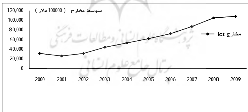
نمودار 1. روند متوسط مخارج ICT در کشورهای سازمان همکاری اسلامی (2000-2009)

مأخذ: World Development Indicators (2010)