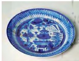
تصویر ۲۹. موزه بروکلین نیویورک، شماره: ۲۰۰۵۳۵، مأخذ: سایت موزه.