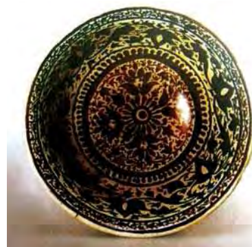
تصویر ۴۰. کاسه، مجموعه خلیلی، شماره: Pot 1535. مأخذ: خلیلی و ورنویت، ۱۳۸۳: ۲۴۶.