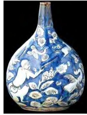
تصویر ۸. بطری، موزه لوور، شماره: MAO253.

این ظروف لعاب شفافی بدنه ظریف، زیبا و سفید را پوشانده است. این ظروف به شکل‌های کوزه، کاسه با کف نیم‌کروی، پیاله و پارچ ساخته شده‌اند و به کشورهای اروپایی صادر می‌شدند (تصاویر ۱۳ و ۱۴).