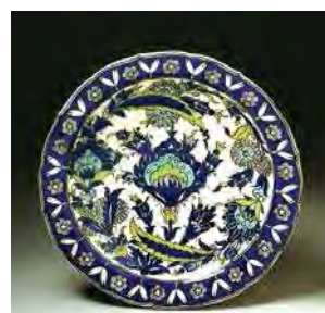
تصویر ۵۰. موزه اشمولن آکسفورد، EA. 1978.1483. مأخذ: سایت موزه.