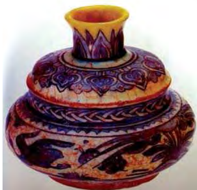
تصویر ۶. سلف دان، ساخت مشهد، موزه طارق رجب کویت، شماره: 998-1876.