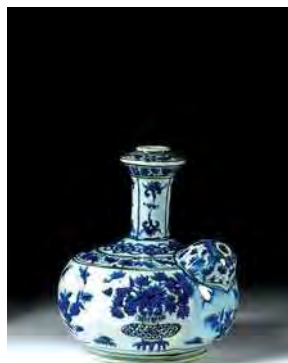
تصویر ۵. کوزه قلیان، قرن ۱۷ م، موزه ویکتوریا و آلبرت، شماره: 998-1876.