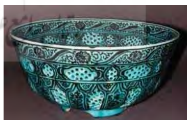
تصویر ۴۴. کاسه، موزه فیتزویلیام کمبریج، شماره: c.4.191.