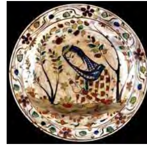
تصویر ۱۶. موزه بریتیش، شماره: MAO656.

گروه نخست: همان‌طور که پیش‌تر اشاره شد، در ظروف چندرنگ کرمان در اواخر قرن هفدهم و اوایل قرن هجدهم میلادی ترکیب جالبی از طرح‌های سفیدآبی همراه با رنگ‌های قرمز متمایل به قهوه‌ای و سبز دیده می‌شود که