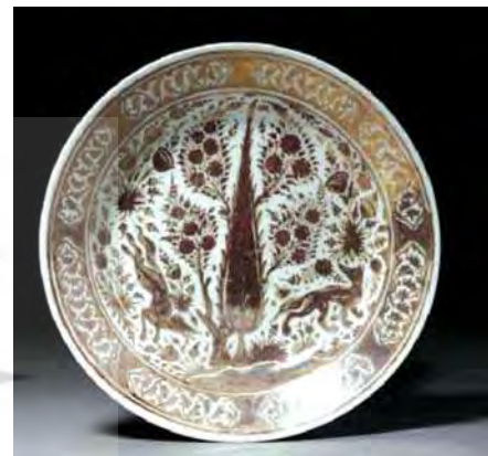
تصویر ۹. بشقاب زرین‌فام، موزه اشمولن آکسفورد، شماره: EAX.1207.

شیوه چندرنگ نوعی تزیین است که نقوش رنگارنگ از گل‌ها، پرندگان، حیوانات و انسان‌ها و... بر زمینه‌ای از لعاب سفیدرنگ اجرا می‌شد و در نهایت پوششی از لعاب شفاف روی آن قرار می‌گرفت. ظروف چندرنگ صفوی دو گونه‌اند: دسته‌ای به ظروف چندرنگ کرمان مشهورند و دسته دیگر گروهی از ظروف کوباچه را تشکیل می‌دهند.