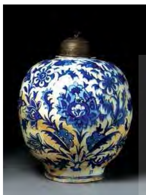
تصویر ۷. گلدان، ساخت اصفهان، قرن ۱۷ م، موزه ویکتوریا و آلبرت، شماره: ۱۹۰۲-۶۹۲.

ترکیه و از جمله عناصر کمیاب در ظروف سفیدآبی است که در سفالینه‌های پلی کروم کرمان آن زمان به چشم می‌خورد (آلن، ۱۳۸۳: ۳۶).