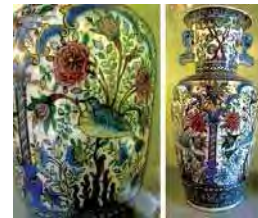
تصویر ۳۷. موزه دکتر مقدم تهران.