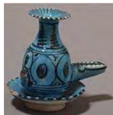
تصویر ۴۵. پیسه‌سوز، موزه ویکتوریا و آلبرت، شماره: HMC.72.