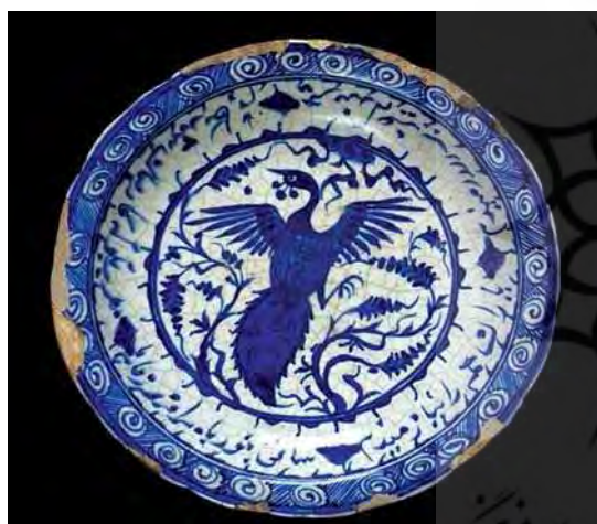
تصویر ۲. بشقاب، ساخت تبریز، قرن ۱۶م، موزه ویکتوریا و آلبرت، شماره: ۵۶۴-۱۹۰۵.

در این پژوهش می‌توانند مورد استفاده قرار گیرند. - فن و هنر سفالگری نام کتابی است از فائق توحیدی که در فصلی به بررسی وضعیت سفالگری در قرن‌های دهم تا سیزدهم پرداخته و سفالینه‌های صفوی را طبقه‌بندی کرده است. توضیحات داده‌شده در این فصل در مورد سفال قاجار بسیار مختصر است. با وجود این، می‌تواند تا حدودی در راستای اهداف این پژوهش راهگشا باشد.