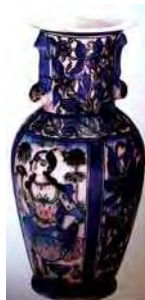
تصویر ۳۲. موزه طاروق رجب کویت، شماره: CER1774TSR.365. مأخذ: همان