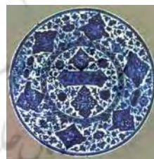
تصویر ۲۴. موزه ملی کویت، شماره: LNS368C، مأخذ: Watson2004، ۴۸۱.