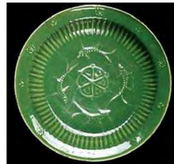
تصویر ۲۰. موزه بریتیش، شماره: MEOA1925.11-21. مأخذ: همان