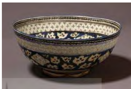
تصویر ۲۲. موزه ویکتوریا و آلبرت، شماره: 1889-517، مأخذ: همان