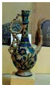
تصویر ۳۳. صراحی، اواخر قاجار و اوایل پهلوی، موزه مردم‌شناسی کاخ گلستان.