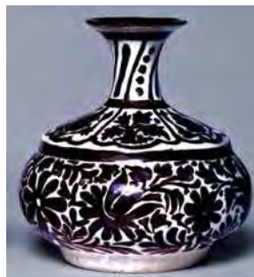
تصویر ۴۱. موزه ویکتوریا و آلبرت، شماره: C.797-1909.

مقداری از ظروف و لوازم سفالی چندرنگ ایرانی نیز در داخل تولید می‌شد که بسیاری از آن‌ها باقی مانده‌اند. ساخت آن‌ها عالی و از سفال زرد نخودی و پوشیده از اکسید قلع سفیدرنگ کدر که سطح ظرف را برای تزئین مناسبی از