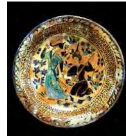
تصویر ۱۷. موزه بریتیش، شماره: MAO656. مأخذ: همان