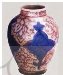
تصویر ۴۲. موزه طارق رجب کویت، شماره: NO.353.CER1170TSR.