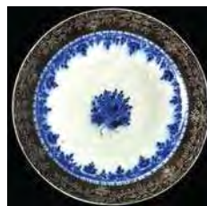
تصویر ۲۱. موزه ویکتوریا و آلبرت، احتمالاً ساخت ناپلین، شماره: 1786-868

این شیوه طراحی برای ظروف ارزان قیمت که برای ظروف مصرفی عموم مردم بوده است و به علت کمبود زمان و کاهش هزینه، دقت چندان در آن‌ها صرف نشده و رنگ‌ها از خطوط دورگیری بیرون زده‌اند. در ظروف سفارشی و گران قیمت، که وقت بیشتری برای آن‌ها صرف شده است، دقت و ظرافت بیشتری به چشم می‌خورد. در این ظروف،