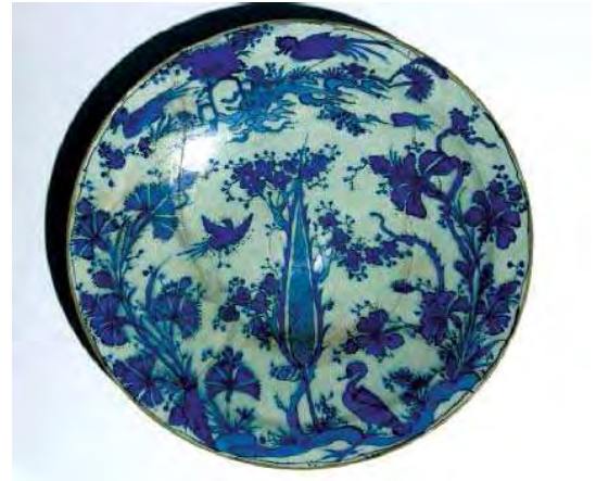
تصویر ۳. بشقاب، اوایل قرن ۱۸م، موزه اشمولن آکسفورد، شماره: EA1986.50.

سفالینه‌های سفیدآبی صفوی غالباً کیفیت خوبی داشتند و حتی نمونه‌های عادی آن نازل‌تر از ظروف چینی نبود. این ظروف ته‌رنگی بنفش‌فام دارند که شبیه آبی اسلامی ۲ دوره مینگ است و مانند آن نرم و متمایل به درهم‌ریختگی و بیرون‌زدگی در خطوط اصلی است. این آثار، به‌رغم اقتباس از هنر چین، با هنر ایرانی این دوره به تمام و کمال سازگار شده‌اند. شکل‌های مورد پسند در میان سفالگران سفیدآبی صفوی دقیقاً از ظروف چینی وارداتی اقتباس شده و شامل کاسه گود، گلدان شانه‌دار با پایه فشرده، انواع کوزه‌قلیان و بشقاب‌هایی به اشکال مختلف‌اند (پوپ و اکرم، ۱۳۷۸: ۱۸۷۷). در دوره شاه عباس چینی سازان صفوی موفق شدند بدنه بسیار سفید و نیمه‌شفافی مشابه خمیره چینی را به وجود آورند. در اواخر قرن دهم هجری (شانزدهم میلادی) تولید و ساخت ظروف نیمه‌شفاف در یزد آغاز شد که دارای خمیره نرم و تزیینات چینی‌های دوره مینگ ولی مرغوبتر از آن بود، زیرا تزیینات با دو رنگ آبی و آبی‌مشکی بر روی آن نقش می‌پست (کامبخش‌فرد، ۱۳۸۰: ۴۷۲؛ تصویر ۴).