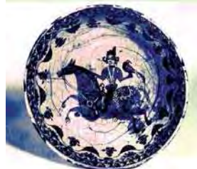
تصویر ۲۵. فریرگالری، شماره: 08132، مأخذ: Atil, 1975: 21.