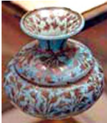
تصویر ۱۰. تقدان، قرن ۱۷ م، موزه بریتیش، شماره: ME G 385.