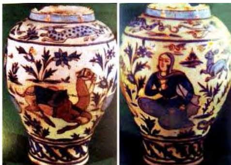
تصویر ۳۰. موزه ملی ایران، قرن ۱۳-۱۲ق.

لعاب شفافی که روی نقش‌ها را پوشانده است اغلب پر از ترک‌های مویی است. تولید این نوع سفالینه در دوره پهلوی نیز تداوم داشته است که ادامه شیوه قاجار بوده است. نمونه‌هایی از این ظروف در تصاویر ۳۳، ۳۴ و ۳۵ قابل مشاهده است.