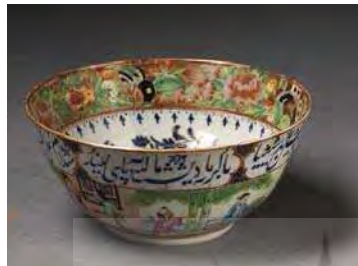
تصویر ۴۷. نمونه‌ای از ظروف مینایی شبیه‌سازی شده در ایران، موزه ویکتوریا و آلبرت، شماره: 1876-1694، مأخذ: همان.