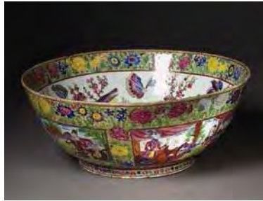
تصویر ۴۶. نمونه‌ای از ظروف مینایی شبیه‌سازی شده در ایران، موزه ویکتوریا و آلبرت، شماره: 632-1878.