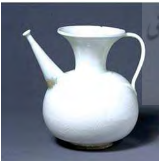
تصویر ۱۴. پارچ، موزه اشمولن آکسفورد، شماره: EA1978.176.

با تغییر پایتخت از اصفهان به شیراز در دوره زندیه و سپس به تهران در عهد قاجار، مراکز هنری نیز به این شهرها انتقال یافت و بار دیگر شرایط اجتماعی و اقتصادی رو به پیشرفت نهاد. افزایش جمعیت و توجه به معماری موجب تشویق سفالگران برای تهیه کاشی به‌منظور تزیین بنا شد. در اصفهان نیز مجدداً کارگاه‌های ساخت ظروف سفالی سفیدآبی و ظروف با نقاشی رنگارنگ زیر لعاب رواج یافت. ساخت و تولید ظروف سفیدآبی در دوره قاجار همچنان تداوم یافت، اگرچه این تولیدات از کیفیت و مرغوبیت نمونه‌های صفوی برخوردار نبودند. استفاده از رنگ لاجوردی تیره روی زمینه سفید ظروف این دوره را از صفویه متمایز می‌سازد.