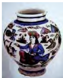
تصویر ۳۱. موزه طاروق رجب کویت، شماره: CER1773TSR.364. مأخذ: feharvari, 2000:300

بررسی تأثیرات شیوه‌های ساخت و تزئین ظروف سفالی و سرامیکی صفوی بر نمونه‌های ساخته‌شده در دوره قاجار