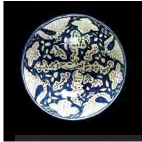
تصویر ۲۷. موزه ویکتوریا و آلبرت، شماره: ۵۹۱-۱۸۸۹، مأخذ: سایت موزه.