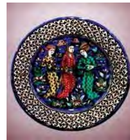
تصویر ۳۸. بشقاب، موزه فیتز ویلیام کمبریج، شماره: c.26-1996. مأخذ: سایت موزه.