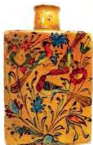
تصویر ۳۵. حراجی eby، لندن

به تاریخ کشورشان ارتباط داشت یا کوششی برای احیای سبک و شیوه ساخت سفالینه‌های قرون میانه بود. در یکی از انواع سفالگری که در تهران رواج داشت، نقش‌های رنگارنگ در زیر لایه‌ای از لعاب قرار می‌گرفتند. بدنه اثر سنگین، سفیدرنگ و به‌خوبی در کوره پخته شده بود، با لایه‌ای ضخیم از لعاب شفاف که هیچ ترکی نداشت (همان: ۲۱۱).