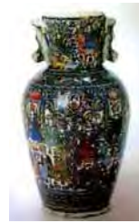
تصویر ۳۶. گلدان بزرگ و جزئیات آن، مجموعه ناصرخلیلی، شماره: pot 1286. مأخذ: خلیلی و ورنویت، ۱۳۸۳: ۲۴۰.

یکی دیگر از ظروف سفالی که تولید آن در دوره قاجار متداول بوده است سفالینه‌هایی با تزیینات نقوش قلم سیاه زیر لعاب شفاف سبزآبی (فیروزه‌ای) است. تولید این نوع