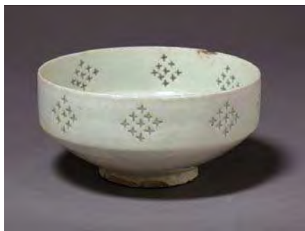
تصویر ۵۳. موزۀ ویکتوریا و آلبرت، شماره: 1876-1378،

بررسی تأثیرات شیوه‌های ساخت و تزئین ظروف سفالی و سرامیکی صفوی بر نمونه‌های ساخته‌شده در دوره قاجار