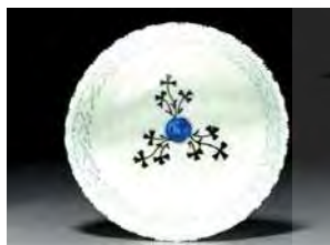
تصویر ۱۳. کاسه، موزه ویکتوریا و آلبرت، شماره: 1884-394.

سلادون لعابی است که با افزودن کمی اکسید آهن احیاء شده به وجود می‌آید و رنگ آن سبز مایل به خاکستری است. این لعاب باعث می‌شود که برجستگی‌های روی ظروف بهتر نمایان شود (کریمی و کیانی، ۱۳۶۴: ۵۷). رنگ این ظروف شامل انواع سبز تیره و روشن است که با تأثیر فراوان از ظروف سبز سلادون چین ساخته شده است. این ظروف خود شامل دو دسته‌اند: گروهی با تزیین برجسته و قالب‌زده ساخته شده‌اند و شکل آن‌ها دقیقاً شکل ظروف چینی است و نقوش تزیینی آن‌ها ازدها، سیمرغ، ماهی و ابرهای پیچنده است و دسته دیگر با تأثیر اولیه از ظروف سلادون ولی با ابتکار هنرمندان ایرانی و با نقوش و تزیینات جدید ساخته شده‌اند (تصویر ۲۰).