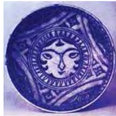
تصویر ۲۶. کاسه، پاریس، مجموعه خصوصی jeansoustil، مأخذ: Soustil، 1985، 306.