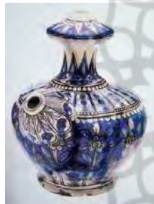
تصویر ۲۸. موزه طارق رجب کویت، شماره: CER1776TSR.363.