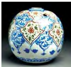
تصویر ۱۵. کوزه، موزه اشمولن آکسفورد، شماره: EA1978.1712.