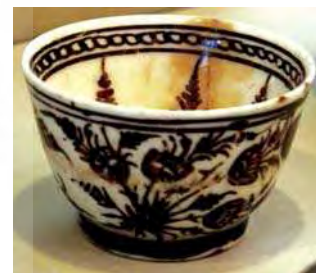
تصویر ۳۹. فنجان کاسه، موزه دکتر مقدم دانشگاه تهران، شماره: ۳.