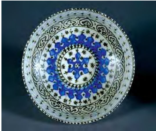
تصویر ۴. ظرف سفیدآبی سفیدی (بزد)، موزه ویکتوریا و آلبرت، شماره: 1910-1958c. مأخذ: سایت موزه.