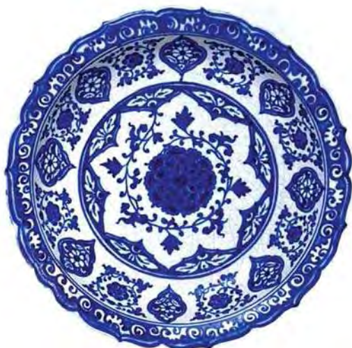
تصویر ۱. بشقاب، قرن ۱۶م، موزه ویکتوریا و آلبرت، شماره: ۵۶۲-۱۹۰۵.