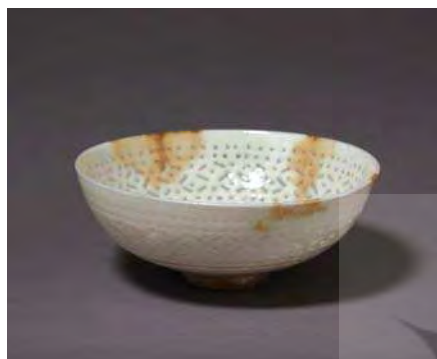
تصویر ۵۴. موزۀ ویکتوریا و آلبرت، شماره: 1876-1381، مأخذ: همان