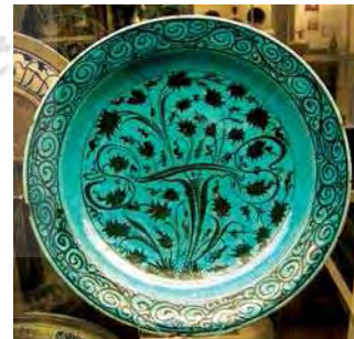
تصویر ۱۹. موزه بریتیش، شماره: Ucad27780.