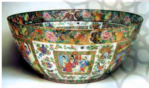
تصویر ۴۸. نمونه‌ای از ظروف مینایی ساخت چین، موزه توپقاپی سرای، مأخذ: Krahl, 2000.