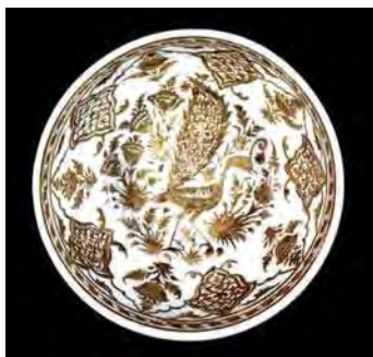
تصویر ۱۱. کاسه، موزه ویکتوریا و آلبرت، شماره: C.1965-1910.

بررسی تأثیرات شیوه‌های ساخت و تزئین ظروف سفالی و سرامیکی صفوی بر نمونه‌های ساخته‌شده در دوره قاجار