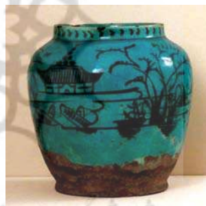
تصویر ۴۳. کوزه کوچک، موزه اشمولن، شماره: ۰۸۰۱۵۷۰۱.