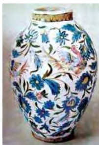
تصویر ۳۴. گلدان، مأخذ: جیکلارک، ۱۳۵۵:۸۶.