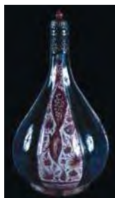
تصویر ۱۲. جام، موزه لوور، شماره: OA6122.

تزیینات این دسته بیشتر چهره‌های بانوان، مردان جوان و منظره‌های پر از گل را نشان می‌دهد (همان: ۷۳؛ تصاویر ۱۶ و ۱۷). به‌نظر برخی پژوهشگران، تأثیر رنگ و نقش مایه ظروف ایزنیک ترکیه بر ظروف کوباچه صفوی را نیز نمی‌توان نادیده انگاشت، هرچند نقش‌پردازی و روش استفاده این نگاره‌ها به صورت شیوه‌ای مستقل درآمده و رنگ‌وبویی کاملاً ایرانی دارد.