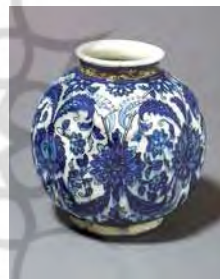
تصویر ۲۳. موزه ویکتوریا و آلبرت، شماره: C.1-1912