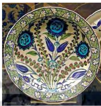
تصویر ۵۲. موزۀ بریتیش، شماره: MEG 1983.2، مأخذ: همان

با صفویان صنعتگران و هنرمندان تبریزی را افزون بر غنایم جنگی به غنیمت برد و در این زمان اقتباس از سبک کاشی‌کاری ایرانی بار دیگر متداول شد. همچنین در دوره سلطان سلیمان عثمانی (۱۵۶۶-۱۵۲۰م)، که قلمرو عثمانی بسیار گسترده شده بود، برای ساخت و تعمیر پروژه‌های ساختمانی دمشق، قبة الصخره و اورشلیم گروهی از این صنعتگران به کار گرفته شدند.