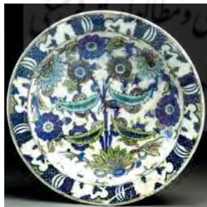
تصویر ۴۹. موزه ویکتوریا و آلبرت، شماره: 1899-125.