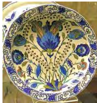
تصویر ۵۱. موزۀ بریتیش، شماره: MEG 1983.4، مأخذ: سایت موزه.