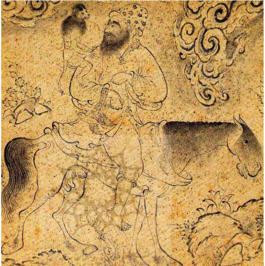
تصویر ۱- لوطی وانترش، حدود ۱۰۰۲ق. مأخذ: Canby, 1996: 83.