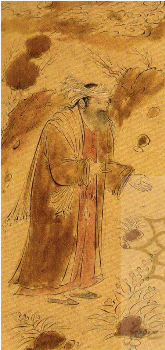
تصویر ۲- شیخ دربیابان یا شیخ در زمین بایر ۱۰۱۴-۱۰۱۲ ق. مأخذ: همان، ۷۹.

بر اساس کدامیک از رویکردهای جامعه‌شناسی بررسی کرد، می‌توان چند گزینه را در نظر گرفت. با توجه به نگاه آرمانی و فرازمینی که در هنر نگارگری ایران اصلی اساسی بوده است، شاید بتوان این هنر را قائم‌به‌ذات و در رویکرد اول جای داد.