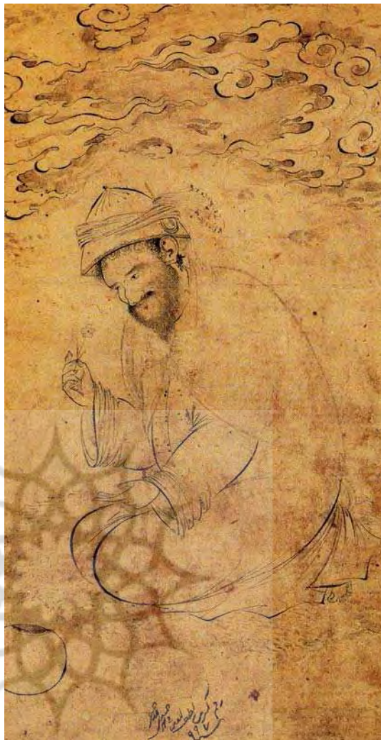
تصویر ۶- درویش نشسته با گلی در دست، ۹۹۷ق، ماخذ: همان، ۶۱.

او با برگشت به دربار مجدداً به تصویرگری نسخه‌های خطی روی می‌آورد، نسخه‌هایی همچون گلستان سعیدی و مخزن‌الاسرار متعلق به این دوره است. «آثار دوران پایانی