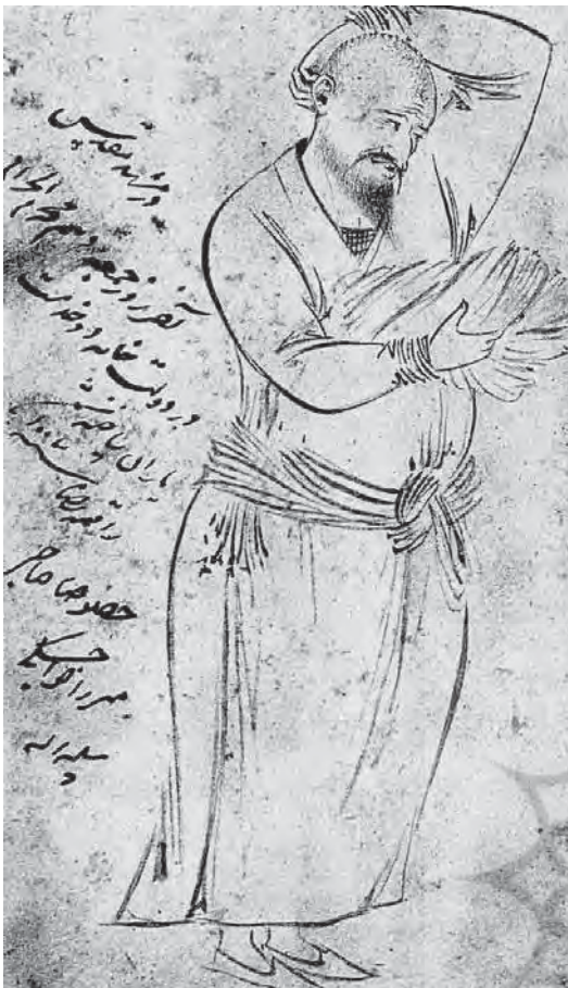
تصویر ۴- زائری از مشهد، ۱۰۰۶ ق.

تنوع در مضامین نگاره‌ها: «برای نخستین بار، هنرمندان توانستند آزادانه بدون سرپوش‌نهادن بر چهره متکدیان، لوطیان، کارگران و روسپیان جامعه ایران را با همه تنوع و چندگونگی‌اش به تصویر کشند. از این رو، نقاشی از صحنه‌های زندگی روزمره، چهره‌پردازی از درویشان و کودکان و تصویرپردازی از خیمه و خرگاه چادرنشینان به مجموعه مضامین هنرمند دوره صفوی افزوده شد» (کنبی، ۱۳۸۴: ۳۱). نتیجه این تغییر را می‌توان گسترش سطح مخاطبان هنر نگارگری و استقلال نسبی در انتخاب موضوع دانست که موجب تنوع موضوعات در کارهای انفرادی هنرمندان نگارگری چون رضا عباسی شد.