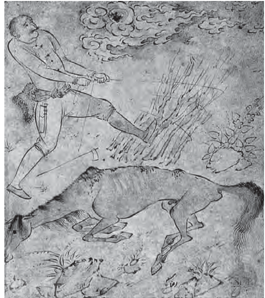
تصویر ۵- روستایی واسب نحیف، حدود ۱۰۰۰ ق. مأخذ: همان، ۴۸