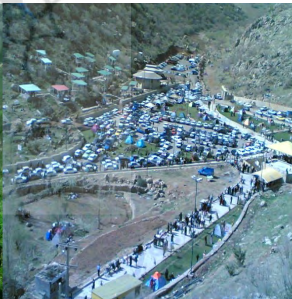
مجموعه تفریحی - توریستی غار قوری قلعه