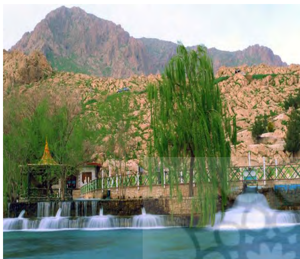
سراب روانسر در شهر روانسر

- استفاده از توانمندی مرزی بودن منطقه (داشتن فرهنگ مشترک کردستان عراق) در زمینه جذب گردشگران این کشور