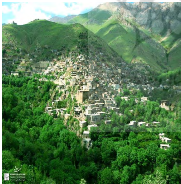
شهر نودشه در شهرستان پاوه