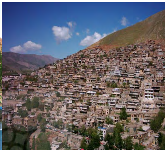
نمایی از شهر پلکانی پاوه