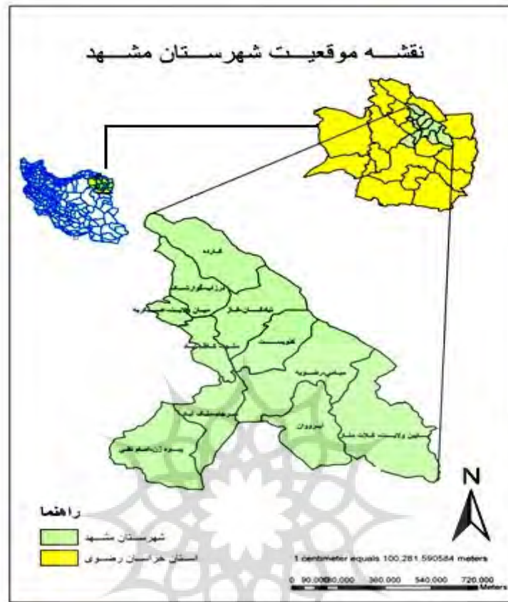
شکل ۱: نقشه موقعیت شهرستان مشهد به همراه تقسیمات اداری-سیاسی