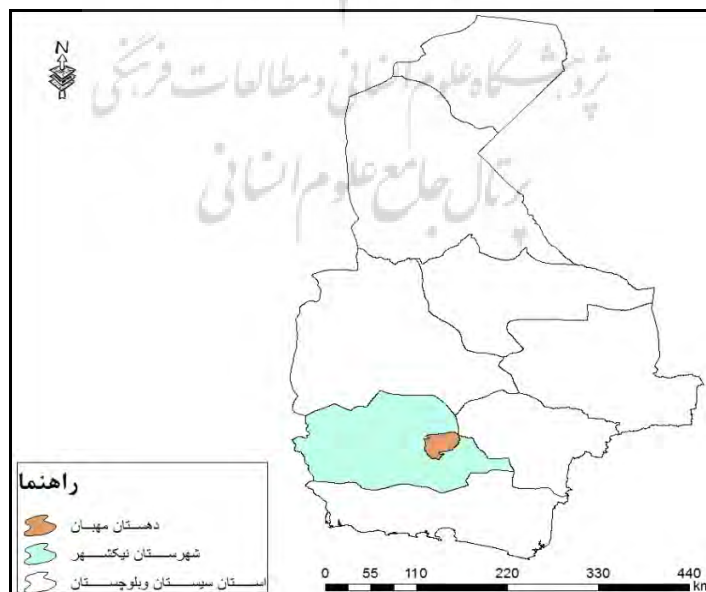
شکل ۱: موقعیت محدوده‌ی مورد مطالعه در شهرستان و استان

شهرستان نیکشهر که در عرض جغرافیایی ۲۶ درجه و ۱۳ دقیقه شمالی و در طول جغرافیایی ۶۰ درجه و