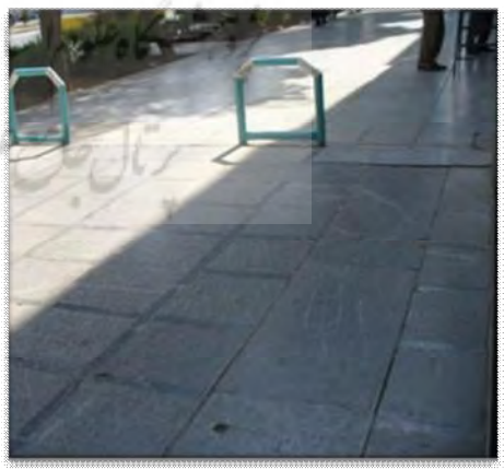
شکل (۳) مسیر عابر پیاده مطلوب و نامطلوب در محورهای انتخابی