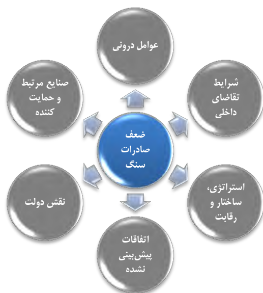
شکل ۴. مدل نظری تحقیق