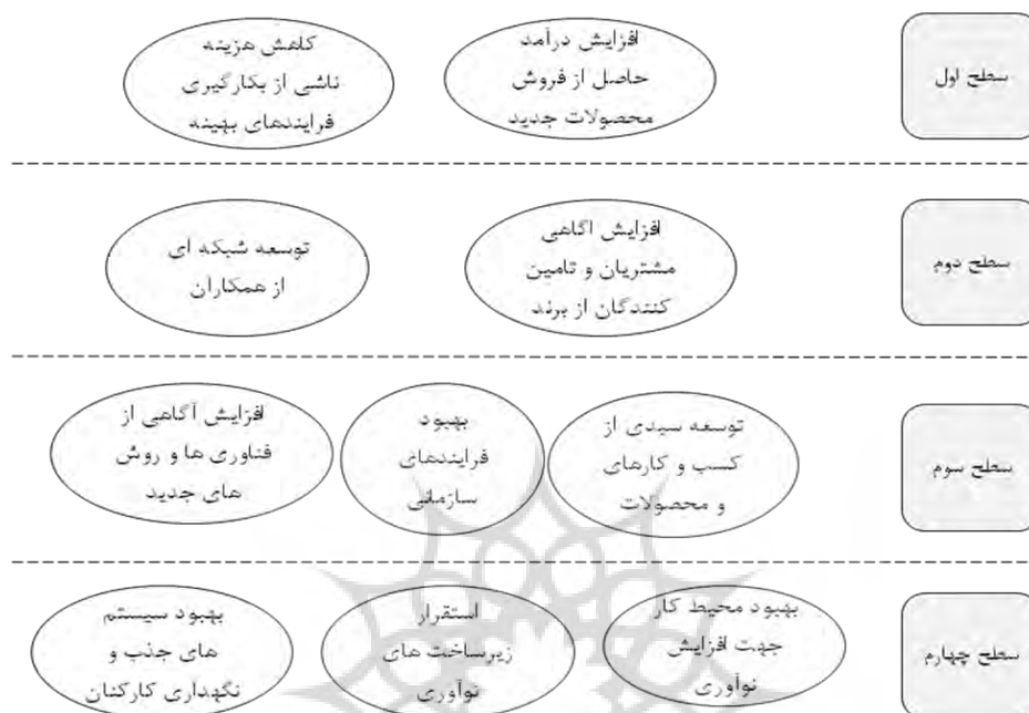
نمودار ۱. ترسیم سلسله مراتبی عوامل (ترسیم مدل اولیه)

ترسیم مدل اولیه. در نمودار زیر، مدل اولیه که حاوی سلسله مراتب اجزا از سطح چهارم تا سطح اول که حاوی خروجی‌های عملکرد شرکت مادر تخصصی می‌باشد، ملاحظه می‌گردد.