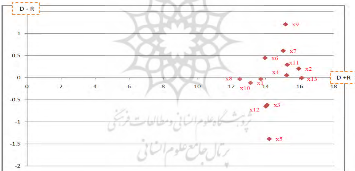
نمودار ۱- نقشه روابط علت و معلول

پس از رسم نقشه روابط و تقسیم بندی شاخصها به دو گروه اثرگذار(گروه علت) و اثرپذیر (گروه معلول) و تعیین اثرگذارترین و اثرپذیرترین شاخصها در مرحله قبل، در این مرحله به تعیین وزن هر یک از شاخصها با کمک روش ANP می پردازیم. جدول نهایی وزن هر یک از شاخصها در جدول(۸) ارائه گردیده است: