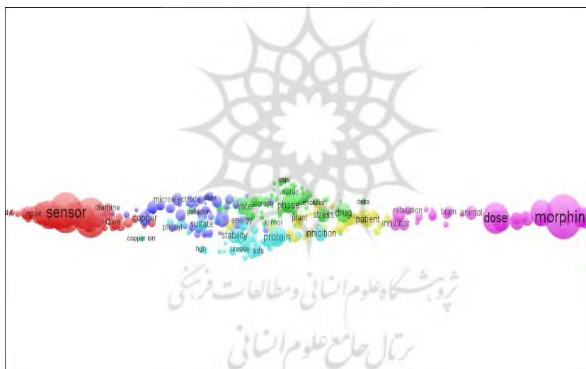
شکل ۲. نقشه هم‌واژگانی مقالات دانشگاه تهران

از دهه ۱۹۶۵ شروع به شکل‌گیری کردند و نزدیک به سال ۲۰۰۰ به اوج استنادی خود رسیده‌اند. ارتباطات درونی این خوشه‌ها حاکی از آن است که این خوشه‌ها دارای ارتباط موضوعی هستند. خوشه‌های ۱، ۱۰ و ۱۲ گستره زمانی کوتاهی نسبت به سایر خوشه‌ها دارند و می‌توانند مبین ایجاد حوزه‌های پژوهشی جدید در دانشگاه تهران باشند. سه خوشه بزرگ شبکه هم‌استنادی دانشگاه تهران (خوشه‌های ۶، ۷ و ۸) با محوریت الکتروشیمی به موضوعات تخصصی‌تر سنسورها، الکترودها و غشای مولکولی پرداخته‌اند. بیوشیمی مولکولی (خوشه ۱ و ۱۳)، شیمی مواد (خوشه ۲، ۳ و ۱۲)، طیف‌سنجی (خوشه ۴)، شیمی - ریاضی (خوشه ۵ و ۵)، الکتروشیمی (طیف‌سنجی) و کاربرد آن در داروسازی (خوشه ۹)، سم‌شناسی (خوشه ۱۰ و ۱۱)، حوزه‌های موضوعی نسبتاً کوچکی در مقالات دانشگاه تهران هستند.