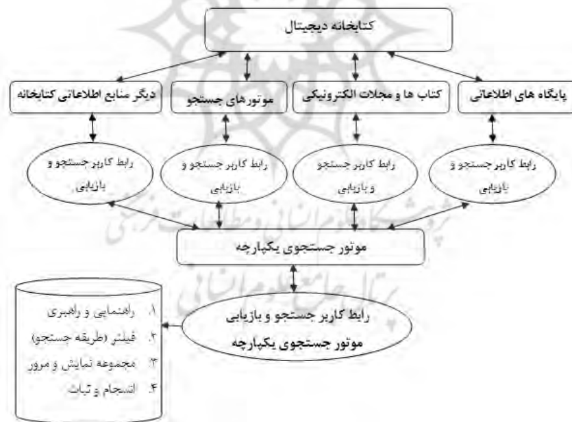
تصویر ۱. معماری موتور جستجوی یکپارچه

در اولویت‌بندی معیارها، معیارهایی همچون محدود کردن جستجو به فیلد موضوع، جستجوی کلیدواژه‌ای ساده، امکان تغییر حالت بین انواع جستجو، مرتب‌سازی نتایج بر اساس عنوان، امکان محدود کردن جستجو به فیلد عنوان، امکان انتخاب پایگاه‌های اطلاعاتی و امکان مرور مدارک بر اساس موضوع از اهمیت بسیاری برخوردار هستند. همچنین، در رتبه‌بندی مؤلفه‌ها، مؤلفه‌های راهنمایی و راهبری و فیلتر جستجو نسبت به دیگر مؤلفه‌ها از اهمیت بیشتری برخوردار هستند.