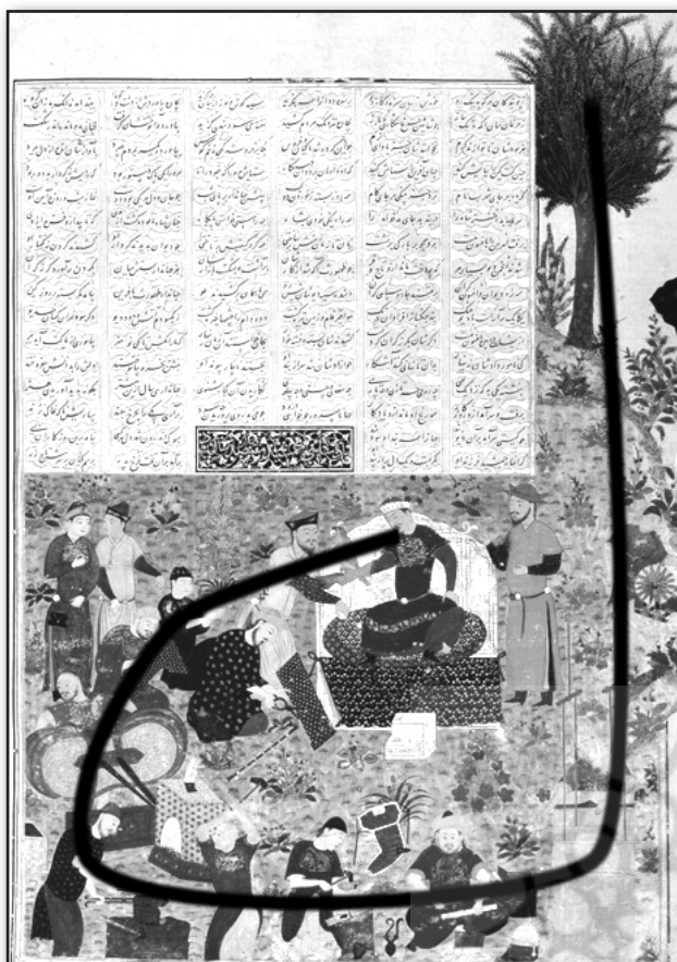
تصویر ۳. ترکیب‌بندی J گونه مقاله.