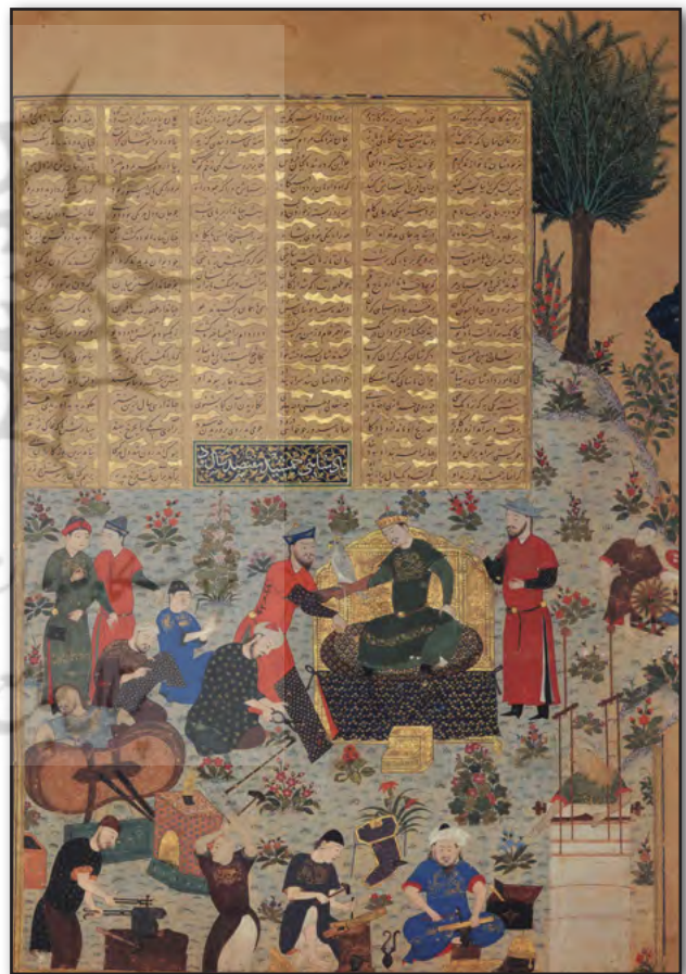
تصویر ۱. نگاره پادشاهی جمشید. مأخذ : شاهنامه بایسنقری. کتابخانه موزه گلستان. ۸۳۳ ه. ق.

پرداخت منحصر به فرد عناصر در این اثر می‌تواند به عنوان یکی از ابزارهای نسخه‌شناسی و تشخیص نگاره‌ها به کار آید (تصویر ۱).