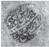
ابعاد : ۴۰ میلی متر. جنس: نامعلوم، (تصویر ۹، ۱۶)