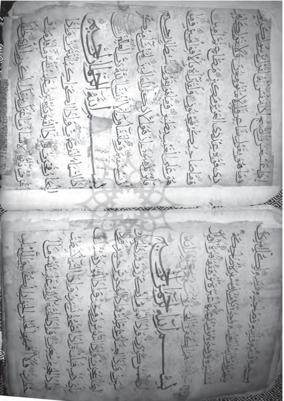
پیام بهارستان / ۲۵، ش ۱۹ / بهار ۱۳۹۲