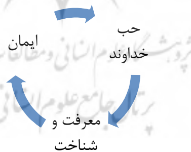
شکل ۳ - رابطه بین ایمان، محبت و معرفت

با اندک تأملی در این روابط و با دقت در مفهوم ایمان و محبت حقیقی، می‌توان ادعا کرد که هم ایمان حقیقی و هم محبت حقیقی تنها بر بستر معرفت و شناخت امکانپذیر است. در حقیقت هر چقدر شناخت و معرفت ما از جهان هستی و انسان و روابط آنها با خداوند، عمیقتر و جامعتر باشد، ایمان به خداوند و نهایتاً میل و رغبت ما به او نیز به همین نسبت بیشتر خواهد بود. از سوی دیگر هر چه ایمان ما بیشتر، تمایل به شناخت و انگیزه کسب معرفت نیز بیشتر، هم‌چنین هر چه محبت ما به حق بیشتر، تمایل به شناخت بیشتر خواهد بود. شکل ۳ نشان‌دهنده این روابط است.