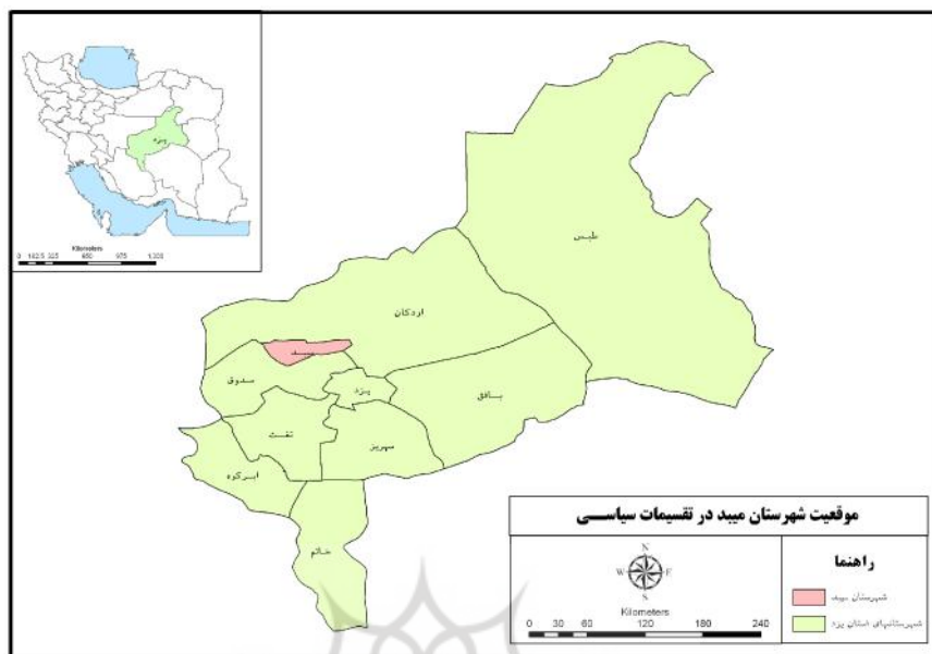
شکل ۱: موقعیت شهرستان میبد در استان و کشور