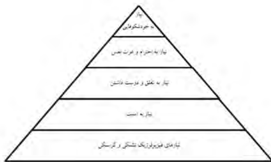
( حاجی یوسفی و همکاران، ۱۳۸۵: ۴۰ )

از نظرمولار، امنیت اجتماعی ضامن تأمین امنیت برای گروه‌های اجتماعی جامعه است. گروه‌هایی که به جهت ایجاد اشتراکات و تعلقات میان اعضایشان، هویت جمعی آنان را به خانواده، دوستان، هم‌محیطی‌ها و غیره پیوند می‌دهد. خطرات هم شامل تمام عواملی است که با کاهش روابط و مناسبات میان افراد و گروه‌ها باعث از هم پاشیدگی گروه‌ها می‌شوند (نوبدینیا، ۱۳۸۵: ۴۳).