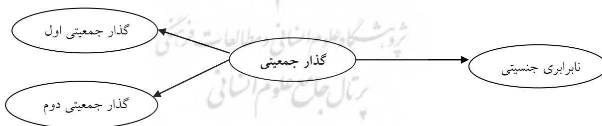
شکل ۱- مدل نظری تحقیق

بر اساس رهیافت نظری فوق، می‌توان مدل نظری و فرضیه زیر را مورد آزمون تجربی قرار داد: