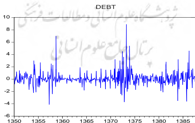
نمودار ۲. تغییرات جزء نسبت بدهی بانک‌ها به بانک مرکزی (نرمال شده) شاخص طی دوره زمانی (۱۳۵۰-۱۳۸۷)

همانطور که در نمودار (۱) ملاحظه می‌گردد دوره‌هایی که در اقتصاد ایران شاخص تنش بازار پول با نوسان‌های زیاد همراه بوده و به عبارت دیگر، با تنش در بازار پول بالا بوده است تجربه شرایط بحران بانکی وجود داشته است.