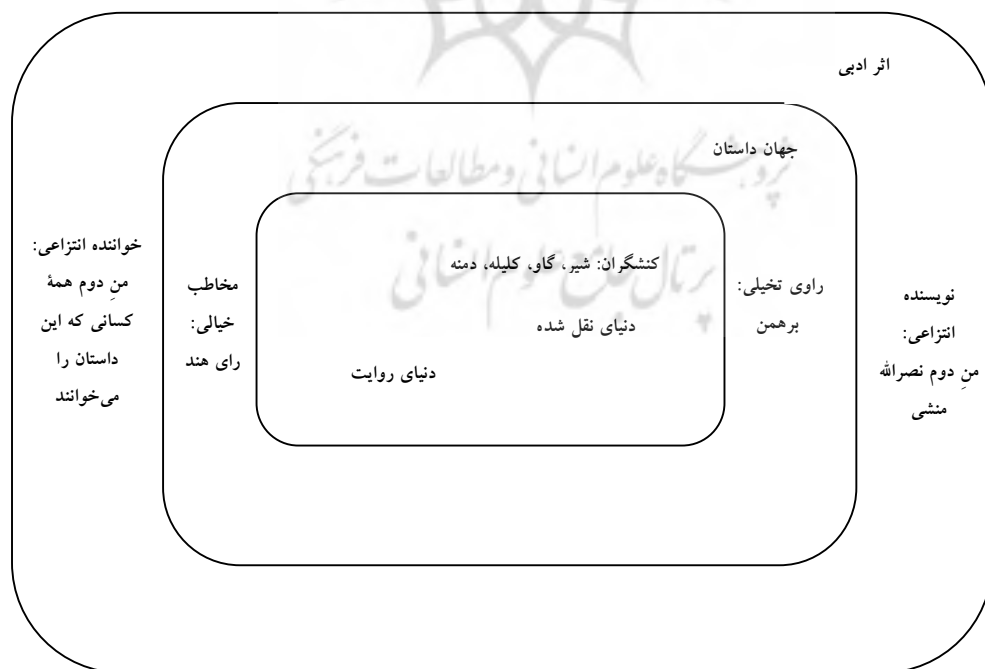
شکل شماره ۳: ساختار وجوه روایتی در داستان شیر و گاو از کلیله و دمنه