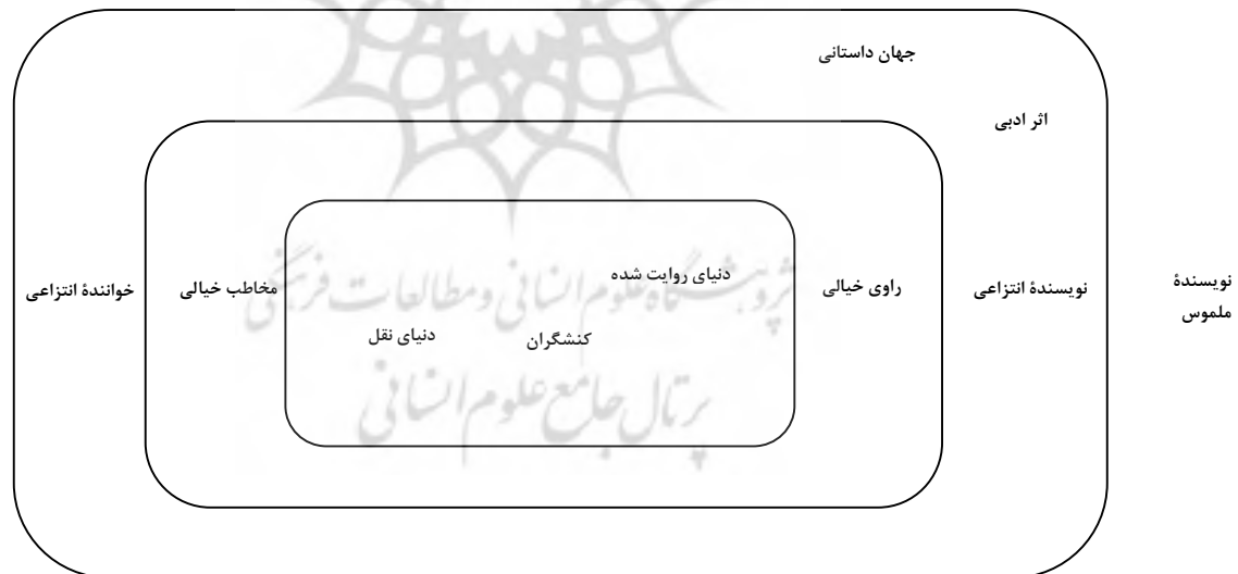
شکل شماره ۲: وجوه متن روایی ادبی (عباسی و حجازی، ۱۳۹۰: ۲۴)

لیت ولت معتقد است که هر اثر ادبی دارای یک نویسنده ملموس و یک نویسنده انتزاعی و همچنین خواننده واقعی، خواننده ملموس و راوی تخیلی است. بر اساس نظریه لیت ولت، نویسنده ملموس (واقعی) «خالق واقعی اثر ادبی است و به عنوان فرستنده پیامی را به خواننده ملموس، که گیرنده یا دریافت کننده پیام است، می فرستد. نویسنده ملموس و خواننده ملموس شخصیت های تاریخی و زندگی نامه ای هستند که هیچ گونه تعلق به دنیای اثر ندارند بلکه تعلق آنها به دنیای واقعی است که در آن زندگی مستقلی را جدای از متن ادبی تجربه می کنند» (عباسی و حجازی، ۱۳۹۰: ۵). خواننده ملموس «به عنوان گیرنده اثر، در جریان گذر زمان دچار تغییر می شود، مساله ای که می تواند سبب دریافت های کاملا گوناگون و حتی متفاوت از یک اثر ادبی در طول زمان شود» (عباسی و حجازی، ۱۳۹۰: ۵). الگوی ترسیمی «وجوه متن روایی ادبی» بر اساس نظریه تمایز بین سطوح روایی در یک متن را بهتر نشان می دهد: