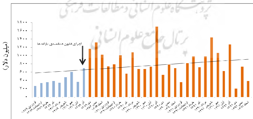
نمودار ۲. صادرات میعانات گازی