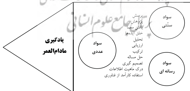
نمودار ۱: دامنه سواد اطلاعاتی

عصر اطلاعات با توسعه سریع فن آوری اطلاعات و افزایش نیاز افراد به توسعه مهارت‌های مورد نیاز برای دستیابی به اطلاعات ضروری در موقعیت‌های تحصیلی، شغلی و شخصی همراه است. در چنین وضعیتی داشتن سواد اطلاعاتی اهمیت بسیار می‌یابد؛ سواد اطلاعاتی وسیله‌ای برای توانمندسازی فردی است. به طوری که افراد بتوانند اطلاعات ضروری را تشخیص دهند، به تجزیه و تحلیل اطلاعات اقدام کنند، محتوای اطلاعات را با دیدی انتقادی ارزیابی کنند و با ادغام اطلاعات جدید و قدیم دانش نو بسازند (رضوان و همکاران، ۱۳۸۸). عبارت سواد اطلاعاتی برای اولین بار در سال ۱۹۷۰ درباره استفاده از کتابخانه مطرح شد (فورد، ۱۳۷۴). سال ۱۹۹۰، سال بین المللی سواد اطلاعاتی نامیده شد. در سال ۱۹۹۰، براساس تعریف انجمن کتابداران آمریکا با سواد اطلاعاتی فردی است که توانایی تشخیص نیاز به اطلاعات را دارد و می‌تواند به جایابی و ارزیابی اطلاعات مورد نیاز اقدام کند و بالاخره نحوه یادگیری را فراگیرد. شیوه تفکر درباره اطلاعات به عنوان ضرورت زندگی روزمره و برقراری ارتباط با یکدیگر در جوامع اطلاعاتی در سال ۱۹۹۲ توسط مارایس بیان شد (نظری، ۱۳۸۴). بروس نیز سواد اطلاعاتی را به عنوان مجموعه مهارت‌هایی توصیف کرده است که یاری‌کننده افراد در یافتن اطلاعات مورد نیاز هستند و به فراگیری تمام عمر افراد کمک می‌کند (آنجلو و پرادو، ۲۰۰۱). یادگیری تمام عمر، تفکر انتقادی، توانایی حل مسئله و تصمیم‌گیری مبتنی بر اطلاعات در شرایط گوناگون، خودراهبری، همکاری، مشارکت، نوآوری و بالاخره یادگیری نحوه یادگرفتن از جمله کارکردهای عمده سواد اطلاعاتی محسوب می‌شود.