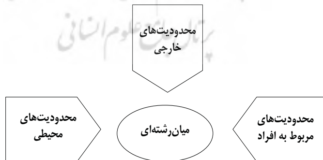
شکل ۲) محدودیت‌های میان رشته‌ای

بنابر آنچه ذکر شد می‌توان محدودیت‌های میان رشته‌ای را در سه دسته قرار داد؛ دسته اول محدودیت‌های محیطی هستند که این محدودیت‌ها شامل؛ داشتن همکاران حرفه‌ای و خیره در کار، منابع، وضعیت و شرایط همکاری و کار گروهی با سایر رشته‌ها، ساختار گروه و دانشکده از بعد سازمانی، رهبری برای نظارت و مدیریت کار و سیاست موسسات برای تسهیل یا به تاخیر انداختن کار هستند. دسته دوم به محدودیت‌های مربوط به اشخاص است که این محدودیت‌ها شامل؛ ارزشمند بودن کار گروهی برای افراد، داشتن کارایی و مهارت لازم در امر میان رشته‌ای و سابقه و تجربه کاری افراد است. نهایتاً دسته سوم شامل عوامل خارجی می‌شود که بیرون از دانشگاه قرار دارند از قبیل، حمایت‌های مالی، مشوق‌ها، آژانس‌ها و بنگاه‌ها و... پس مطابق آنچه گفته شد می‌توان این چالش‌ها و محدودیت‌ها را به صورت شکل شماره ۲ نمایش داد.