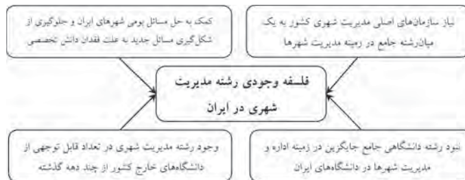
شکل شماره ۲. چهارچوب تحلیلی فلسفه وجودی رشته مدیریت شهری در ایران