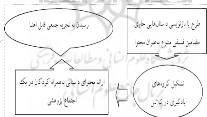
شکل 2. نحوه استفاده از داستان‌های متون کلاسیک ادب فارسی

با توجه به آنچه گفته شد، داستان‌های متون کلاسیک ادب فارسی مضامین مهم در طول تاریخ فلسفه را در خود جای داده‌اند و به سبب غنای ادبی بالا برای استفاده کودکان و ایجاد علاقه در آن‌ها مناسب است. همچنین داستان‌های مذکور بدان سبب که از متون ادب فارسی استخراج شده‌اند، مشکل فرهنگ و ایستگی همچون متون داستانی لیپمن را نخواهند داشت. بنابراین چنانچه این داستان‌ها به گونه‌ای بازنویسی شوند که بتوان از آن‌ها در اجتماع پژوهشی استفاده کرد، امکان دست‌یابی به جنبه‌های بیش‌تری از واقعیت فلسفه برای کودکان فراهم می‌شود. نحوه استفاده از چنین داستان‌هایی در شکل 2 آمده است.