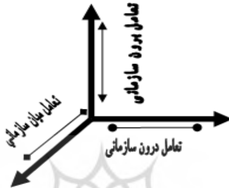
شکل ۲: تعاملات سه گانه در الگوی مفهومی

است. ابعاد سه گانه این الگو در شکل‌های ۲ و ۳ نشان داده شده است.