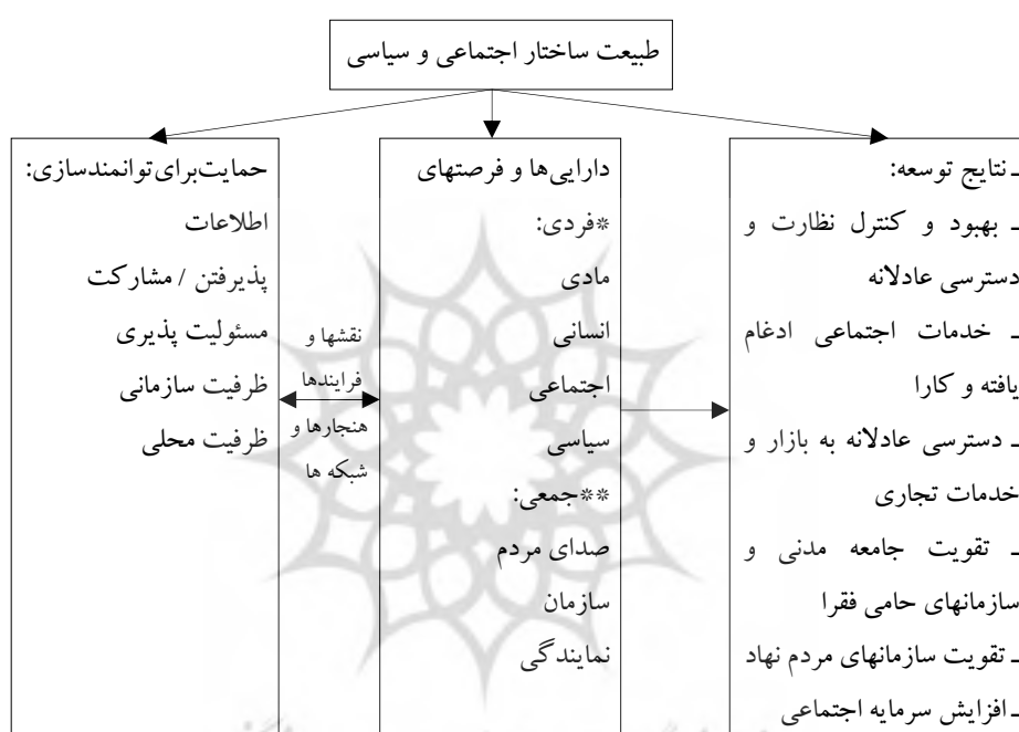
شکل ۱: چارچوب توانمند سازی

شهروندان محروم برای دسترسی به اطلاعات و مشارکت (ب) افزایش مسئولیت پذیری اجتماعی (ج) سرمایه گذاری در سازمانهای حامی فقیران برای حل مشکلات. فعالیت جامعه مدنی و سازمانهای مردم نهاد در انعکاس صدای شهروندان محروم به تصمیم گیران محلی و ملی نقش مهمی ایفا می کند. (رفیعی، ۱۳۸۸: ۳۵ و ۳۶).