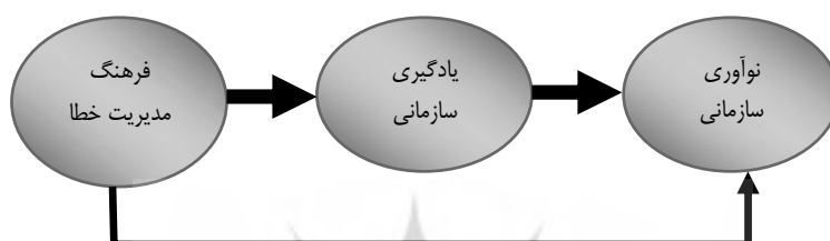
شکل ۱. مدل مفهومی تحقیق

- جیمنز و واله (۲۰۱۱) در تحقیقی با ذکر این نکته که رابطه بین یادگیری، نوآوری و عملکرد سازمانی در یافته‌های پیشین، معمولاً، مثبت ذکر شده است به بررسی نقش ۴ متغیر تعدیل‌گر اندازه، عمر شرکت، تلاطم محیطی و صنعتی بودن شرکت که در این ارتباط؛ پرداختند. با توجه به ادبیات و پیشینه‌ی موضوع می‌توان مدل مفهومی زیر را در نظر گرفت: