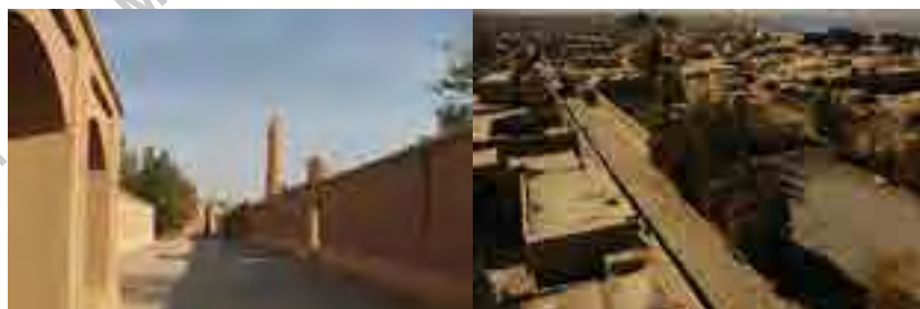
ساماندهی محور اصلی بافت قدیم فهرج