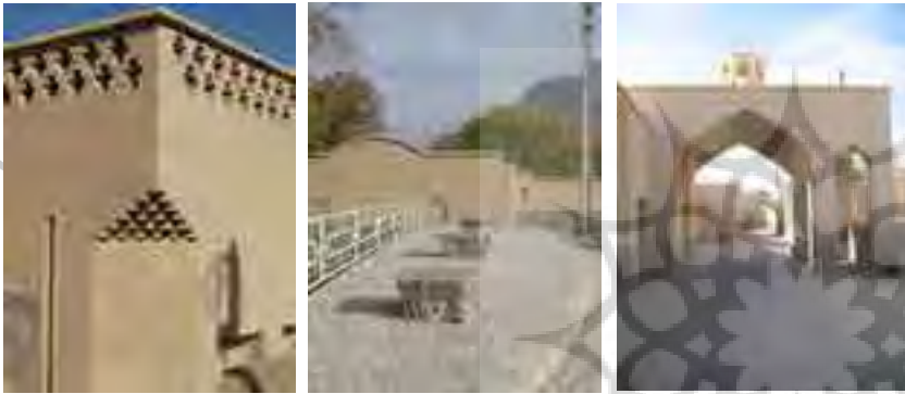
بدنه ها و کف سازی مسیرها اسلامی