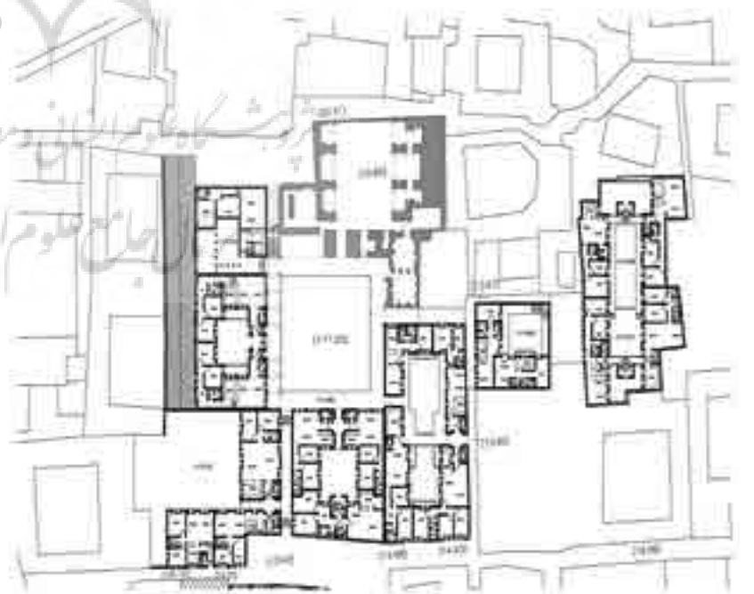
تصویر شماره ۱۳: نقشه همکف مجموعه، گزارش مشاور هنر‌سرای معماری یزد