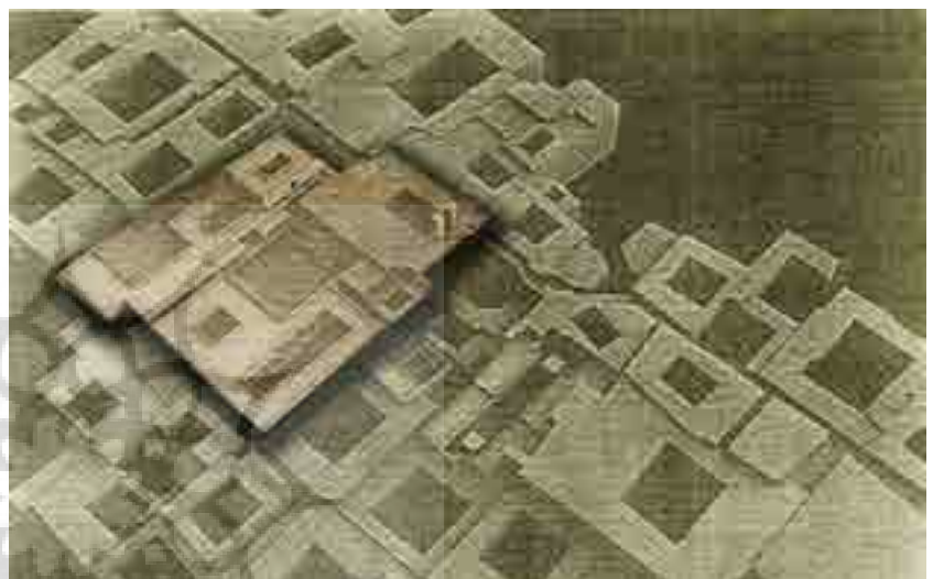
تصویر شماره ۱۲: شبیه‌سازی رایانه‌ای طرح مهندس علوی‌راد، گزارش مشاور هنر‌سرای معماری یزد