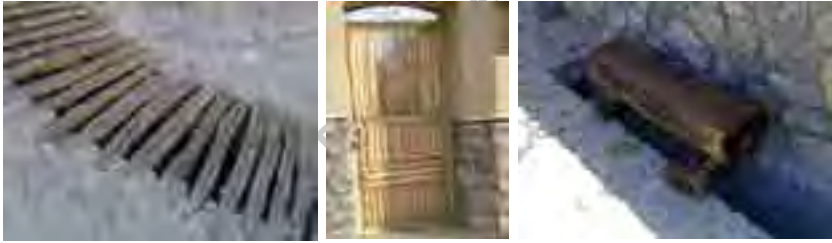
جزئیات بافت روستای اسلامی