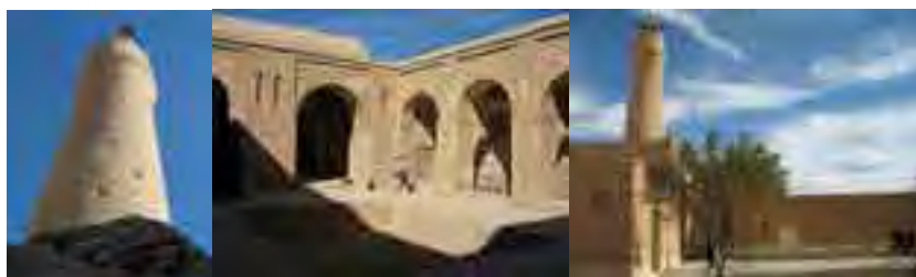
مسجد جامع فهرج، مأخذ: نگارنده

علاوه بر اهمیت تاریخی، روستای فهرج به سبب داشتن اولین و قدیمی‌ترین مسجد جامع ایران، از شهرت ملی و حتی فراملی برخوردار است. مسجد جامع فهرج که از لحاظ ساختاری به بنای مسجدتاریخانه دامغان شباهت فراوان دارد همچون نگینی از دوردست جلب نظر کرده، به طوری که