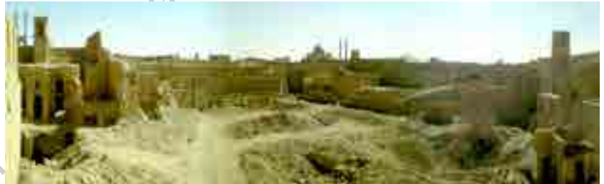
تصویر شماره ۱۱: دید جنوبی محدوده طراحی محله ایلچی خان یزد،