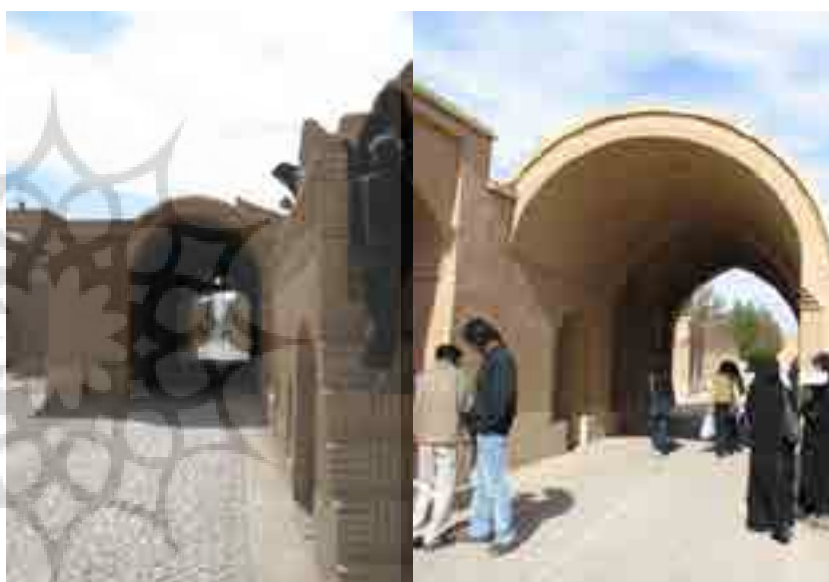
بازسازی ساباط‌های تخریب شده فهرج

این مقاله بر آن است تا با نگاهی اجمالی به بناهای طراحی و مرمت شده توسط مهندس علوی‌راد، و با معرفی و بررسی اندیشه‌ها و آثار و تفکرات شکل‌دهنده آن‌ها، در ارتقاء و بازگویی هویت تاریخی و فرهنگی مناطق روستایی این مرز و بوم مؤثر باشد.