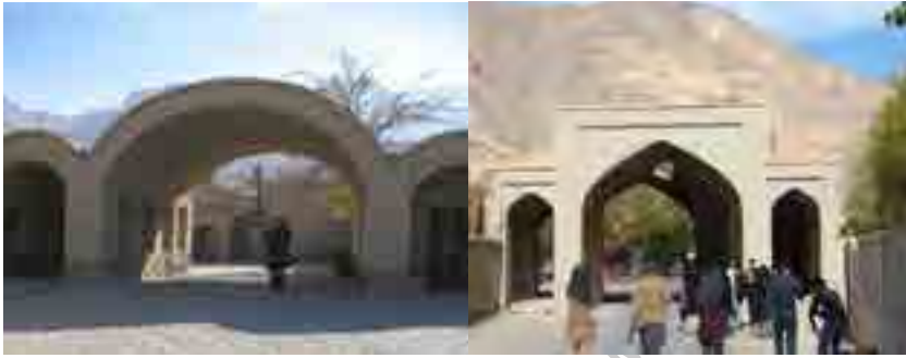
سردرها روستای اسلامی، مأخذ: نگارنده