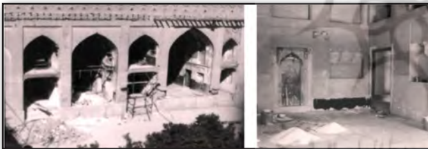
تصویر ۲. نقاشی‌های پوشیده شده در زیر لایه گچ، ارگ کریمخانی شیراز، اواخر دوره پهلوی دوم. Fig. 2. Paintings covered with a layer of plaster - Karim Khani Arg of Shiraz, the end of second Pahlavi era.

در دوره‌های پیشین، علی‌رغم وجود علاقه به ایجاد تزئیناتی چون نقاشی دیواری در فضاهای معماری (کاخ‌ها، منازل مسکونی و...)، اصل ارزشمندتر شدن نقاشی در اثر گذشت زمان و لزوم حفظ اصالت اثر، چندان مورد توجه نبوده و در مقابل زیبایی یک اثر نقاشی