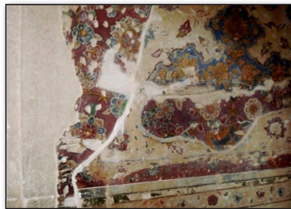
تصویر ۴. لایه‌های نقاشی بر روی هم کار شده، از سمت راست، کاخ چهل ستون اصفهان و کاخ هشت بهشت اصفهان. عکس: پرستو نیری، ۱۳۹۰.