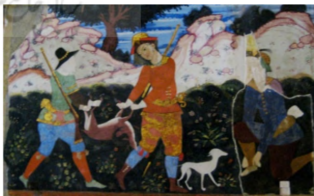
تصویر ۶. از سمت راست، نگاره در تالار اصلی چهل ستون (آثار الحاقات دهه ۲۰ ش.) و نگاره تعمیرشده توسط استاد «رستم شیرازی» و صورت‌سازی پرسوناژ وسط. عکس: پرستو نیری، ۱۳۹۰.