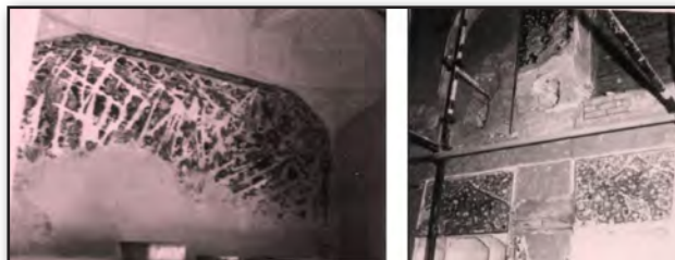
تصویر ۳. نقاشی‌های تیشه‌ای شده بیرون آمده از زیر لایه گچ پس از لایه‌برداری - ارگ کریمخانی شیراز - اواخر دوره پهلوی دوم.