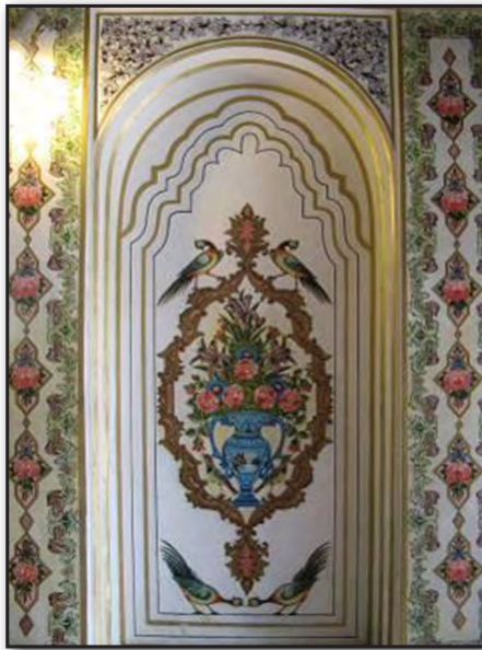
تصویر ۷. نقوش گل و مرغ بازسازی شده در عمارت نارنجستان قوام شیراز. Fig. 7. Designs of flower and bird reconstructed in Narenjestan Qavam mansion in Shiraz.