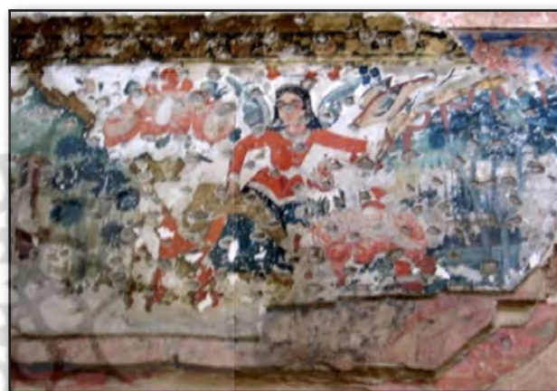
تصویر ۵. لایه‌های نقاشی بر روی هم - کاخ چهلستون قزوین.

را در تازگی، درخشندگی، شفافیت و بی‌عیب و نقص بودن آن می‌پنداشتند. بنابراین با گذشت زمان و تیرگی و چرک شدن اثر و آسیب‌دیدگی آن، به بازسازی یا نوسازی آن اقدام می‌کردند. "این دیدگاه در سده‌های میانه اروپا نیز وجود داشته است، به گونه‌ای که در این دوران، قشر کهنگی ایجاد شده بر سطح آثار هنری از اهمیت زیادی برخوردار نبوده است. هنوز لزوم بررسی زیباشناسانه لایه‌های کهنگی بر سطح آثار و زنگار زمان در میان این جوامع درک نشده بود. در طی قرون وسطی پاکسازی دوره‌ای برای نمای خارجی و فضای داخلی اتاق‌ها به مفهوم رنگ‌آمیزی مجدد به رنگ‌های متفاوت در جهت ایجاد تغییر نو بود. به همین ترتیب، رنگ‌آمیزی مجدد و تغییر و تبدیل برای بسیاری از مجسمه‌های رنگین، نقاشی‌های دیواری و نقاشی سه پایه نیز به اجرا در می‌آمده است" (تصاویر ۶ و ۷)؛ (قانونی، حسینی و فرهنگ‌بروجنی، ۱۳۹۱: ۳۷). استادکار نقاش در مواجهه با اثری که به دلیل مرور زمان فرسوده شده و آسیب دیده، یا در نتیجه تغییرات رطوبت، (چه صعودی و چه نزولی) استحکام خود را از دست داده و دچار انواع ترک