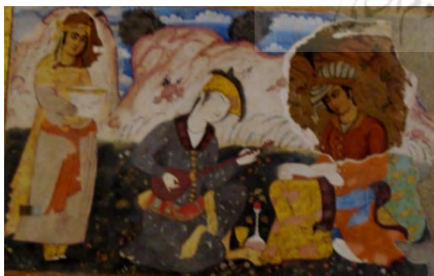
Fig. 5. Layers of painting over each other- Chehel Sotoon castle in Ghazvin.