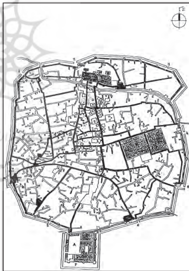
تصویر ۱. موقعیت ارک تبریز نسبت به سور و حصار شهر در اواخر عهد قاجاریه. Fig. 1. The setting of the Arch of Alishah in Tabriz in connection with the city walls and bastions of Tabriz by the end of Qajarid era.