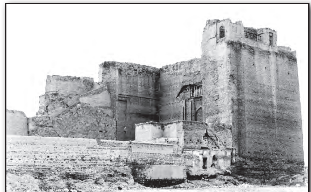
Fig. 11. The final remains of the Qajarid walls in the Arch of Alishah in Tabriz that were destroyed in 1971.

تصویر ۱۱. واپسین بازمانده‌های باروی عهد قاجاری ارک تبریز که در سال ۱۳۵۰ ه.ش. تخریب شد.