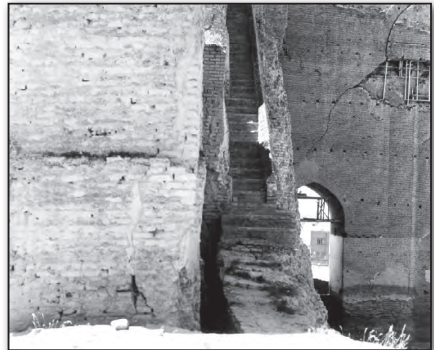
تصویر ۵. گوشه شمال شرقی ارک تبریز: پلکان عهد قاجاری که در سال ۱۳۶۰ ه. ش. تخریب شد. Fig. 5. The northeastern corner in the Arch of Alishah in Tabriz: the Qajarid staircase which had been destroyed in 1981.

پهلوی اول از باستان‌گرایی و نیز الگوهای غربی تأثیر پذیرفت (سهیلی و دیبا، ۱۳۸۹).