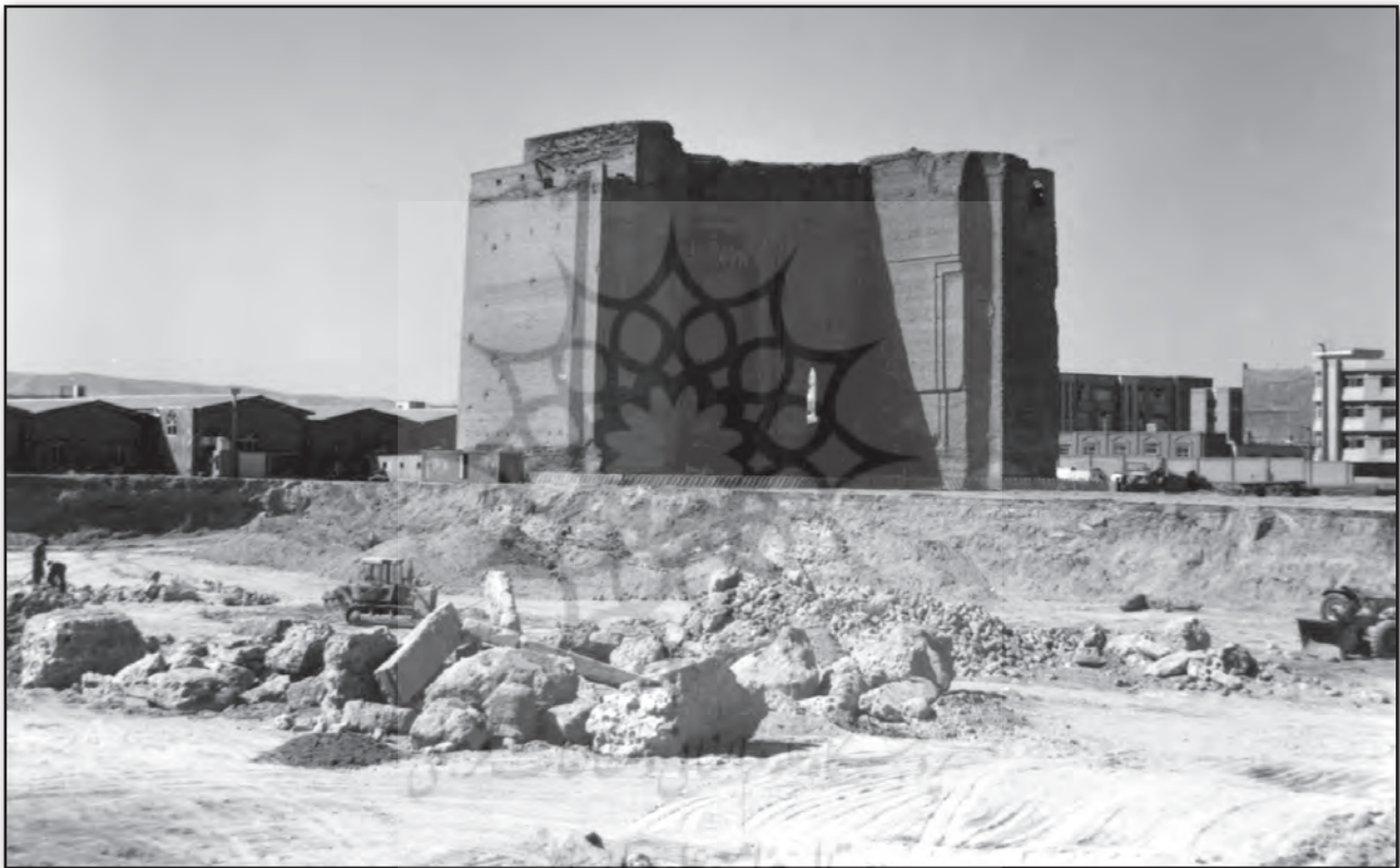
تصویر ۱۰. تخریب حریم شرقی ارک تبریز در سال ۱۳۷۶ ه.ش. عکس: بهرام آجورلو، ۱۳۷۶.

۳) در سال ۱۳۶۰ ه.ش. بخش شمالی دیوارهای عهد ایلخانی ارک علی شاه، مضاف بر پلکان قاجاری متصل به جبهه شرقی آن، با هدف ساخت سازه‌های جدید، تخریب شدند (خیری و صدراپی، ۱۳۸۱).