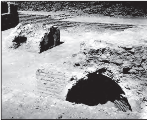
تصویر ۶. جبهه شمالی ارک تبریز: بازمانده کوره‌های آهنگری در کارگاه توپ‌ریزی عهد قاجار که در کاوش‌های سال ۱۳۵۰ ه. ش. آقای سرفراز خاکبرداری شدند. Fig. 6. The northern corner in the Arch of Alishah in Tabriz: the architectural remains of Qajarid blacksmith kilns deployed for artillery manufacturing; all unearthed by A. Sarfaraz's excavations in 1971.