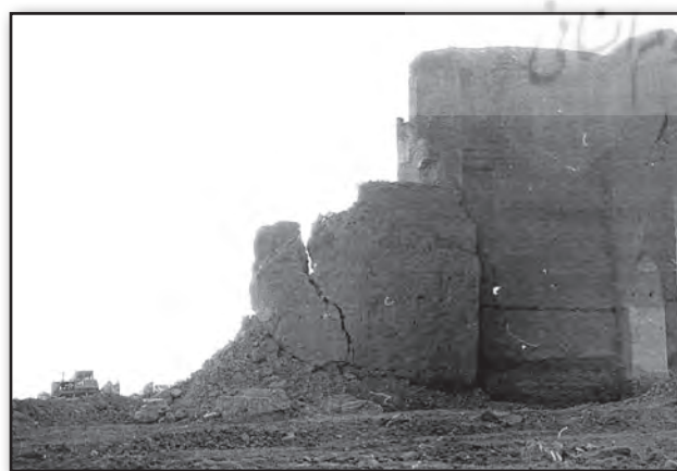
تصویر ۹. تخریب دیوار شرقی جبهه شمالی ارک تبریز در سال ۱۳۶۰ ه.ش. Fig. 9. Destruction of the eastern wall situated in the northern façade of the Arch of Alishah in Tabriz in 1981.