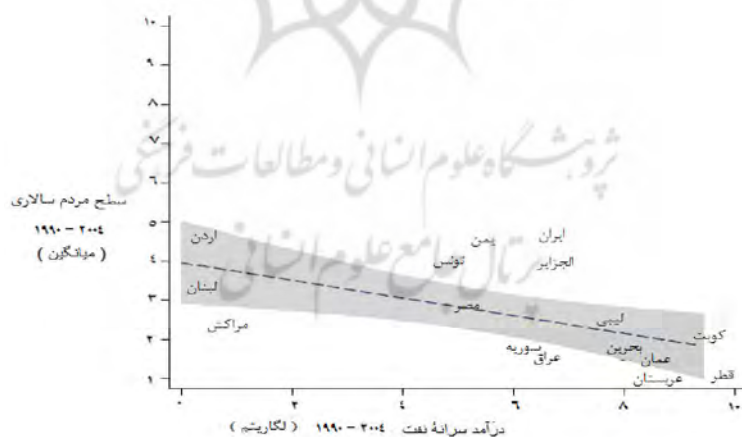
شکل ۱. رتبه‌بندی نفت و مردم‌سالاری در خاورمیانه، ۱۹۹۰-۲۰۰۴