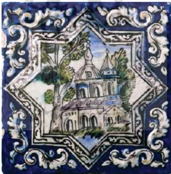
.QAJAR TILE DEPICTING ST :۵ FIGURE