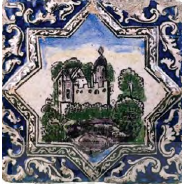
QAJAR TILE DEPICTING AN EUROPEAN CASTLE :۲ FIGURE

کاشی های اروپایی شده دوره قاجار / ندا رسولی