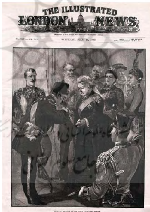
FIGURE 1: NASIR AL-DIN MEETS QUEEN VICTORIA

با اطمینان به اینکه عکاسان از مدل‌هایی استفاده می‌کردند که به نظر می‌رسید در گروه‌هایی از کاشی‌ها کاربرد داشته باشند و آنها در پایان قرن ۱۹ تولید می‌شدند و با سبک دوره‌هایی که در بالا توضیح داده شد، مطابقت داشتند. رنگ در تصاویر و در نقاشی لعابدار سیاه روی یک پس زمینه سفید به کار گرفته شد. در سال ۱۸۹۹ مظفرالدین شاه، نوعی از این کاشی‌ها را در کاخ گلستان تهران داشت. مجموعه «پرنسس هف» شامل آیتی است که شاید در میان این گروه باشد (عکس شماره ۶). تولیدات نقاشی‌های سیاه و سفید از عکس‌های سیاه و سفید الهام گرفته بودند. بنابر استدلال فوق، کاشی‌ها در حال حاضر بر اساس قدمت از پایان قرن ۱۹ و آغاز قرن بیستم، طبقه بندی می‌شوند.