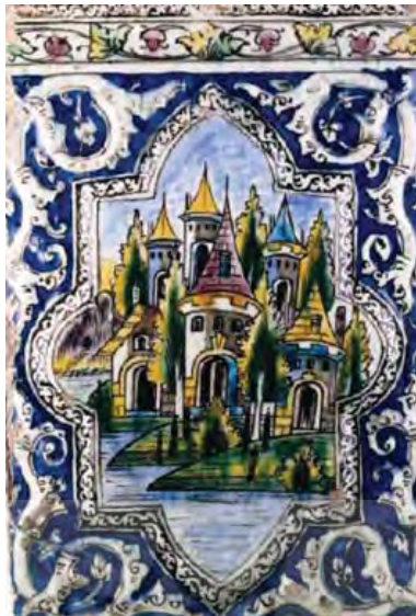
QAJAR TILE DEPICTING AN EUROPEAN CASTLE :۴ FIGURE