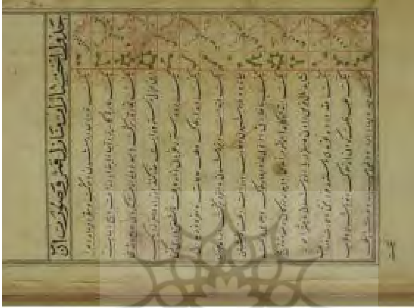
برگ (۳ پ)