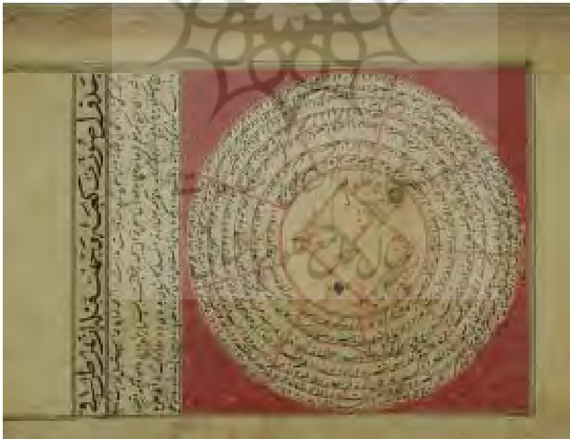
برگ «۲۲ ر»