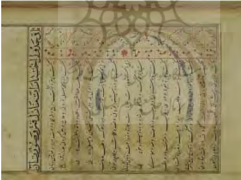
برگ (۴ ر)