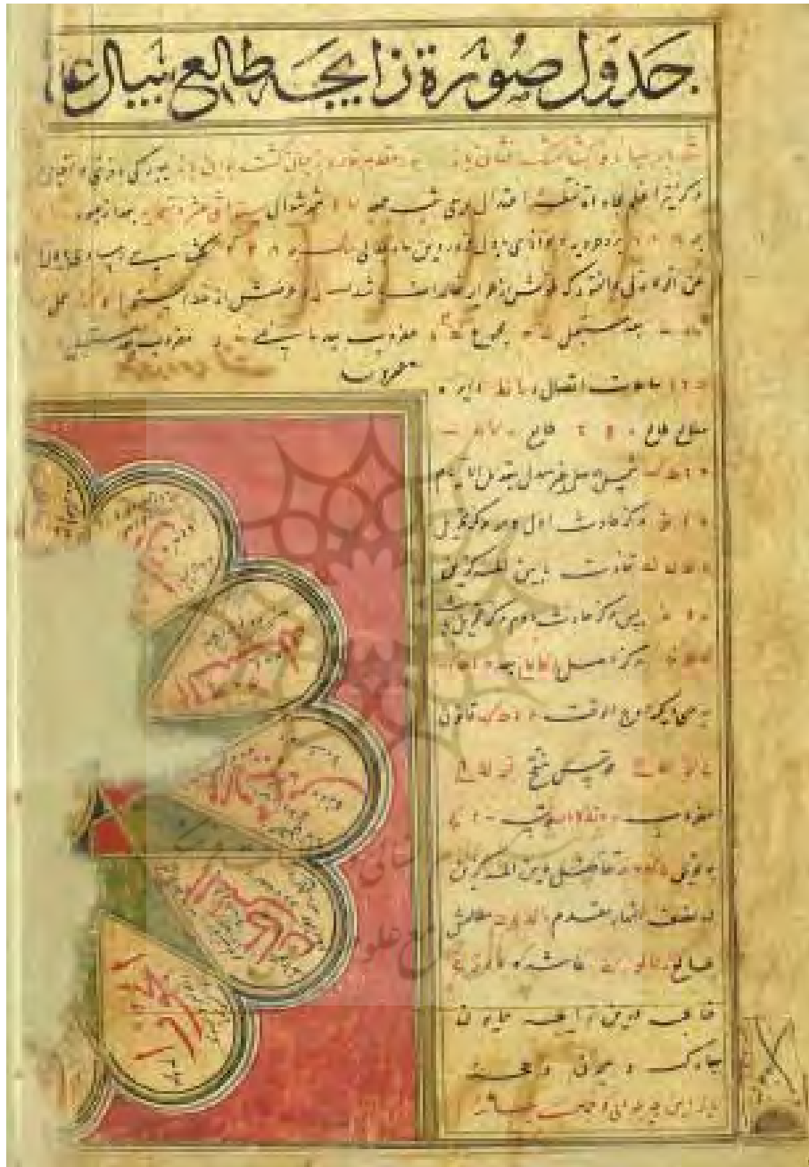
تصویر صفحه پایانی