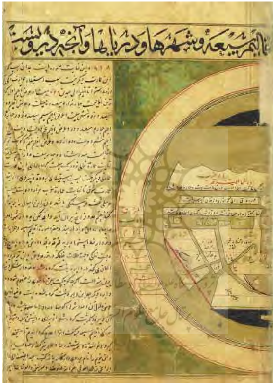
پیام بهارستان / س ۴، ش ۱۶ / تابستان ۱۳۹۱