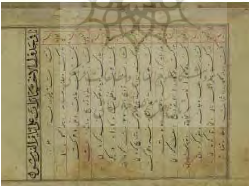
برگ «۲ پ»

پیام بهارستان / ۲۵، س ۴، ش ۱۶ / تابستان ۱۳۹۱