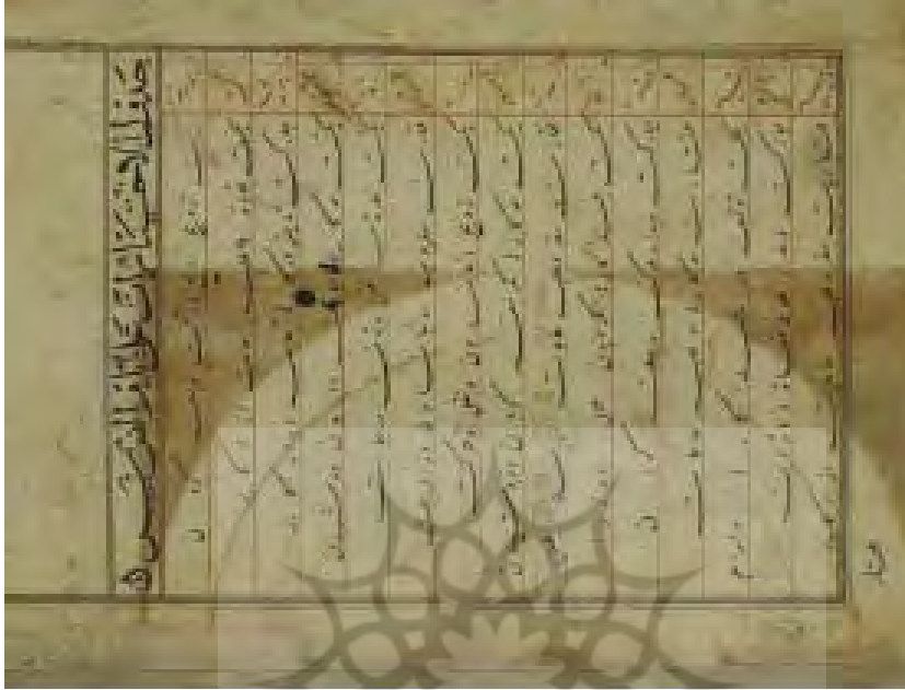
برگ «۱ پ»