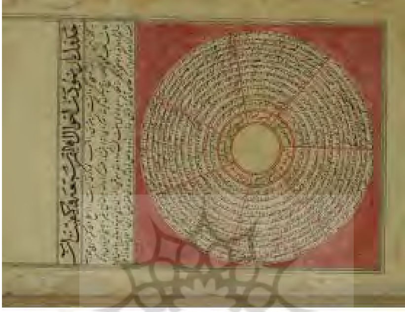
برگ «۲۲ پ»