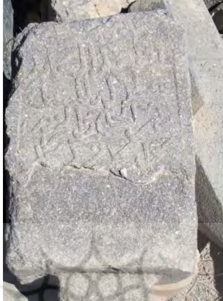
نمونه‌ای از سنگ مزارهای کهن قبرستان کججان