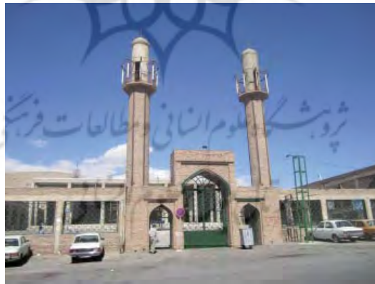
نمای بیرونی آستان خواجه محمد کججانی

امید است مسئولین دست‌اندرکار با حفظ و نگهداری میراث بر جای مانده از گذشتگان و انتقال آنها به مکان امنی مثل موزه اختصاصی سنگ، از تخریب آثار فرهنگی، هنری و ملی ایران اسلامی جلوگیری نموده، آنها را سالم به دست آیندگان بسپارند.