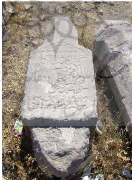
سنگ مزار خواجه محمد