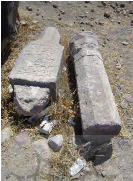
سنگ مزار خواجه محمد و میل سنگی در کنار آن

یادی از مشایخ قبرستان کهن کججان / محمد الوانساز خویی