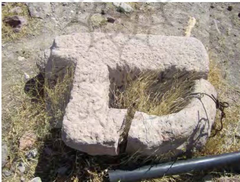
سنگ قوچی شکسته شده

پیام بهارستان / ۲۰، ۴، ش، ۱۵ / بهار ۱۳۹۱