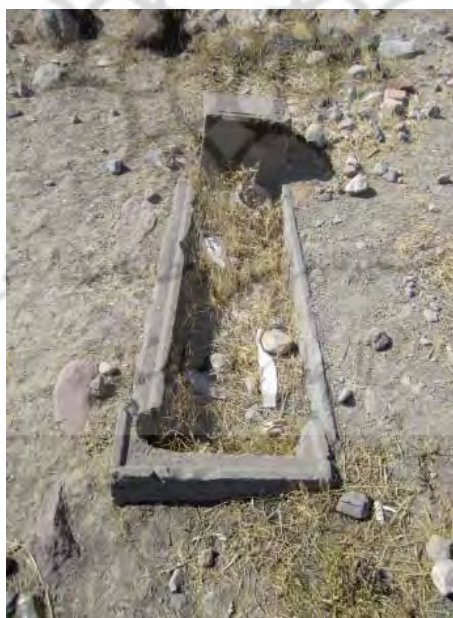
مزار یکی از مشایخ که در حال ویرانی است

پیام بهارستان / ۲۰، ۴، ش، ۱۵ / بهار ۱۳۹۱