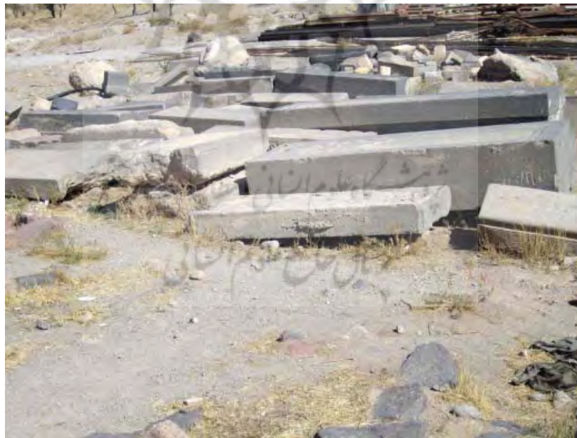
سنگ قبرهای انباشته شده روی هم در قبرستان کججان