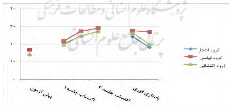
شکل ۱- میانگین عملکرد گروه‌های آزمایشی در مراحل اکتساب و آزمون